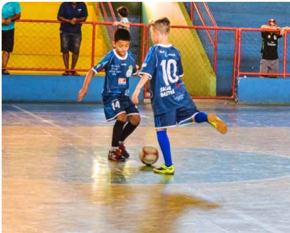
O evento envolve crianças do 1º ao 5º ano do Ensino Fundamental

O evento conta com o apoio da Secretaria Municipal de Educação (Seme).