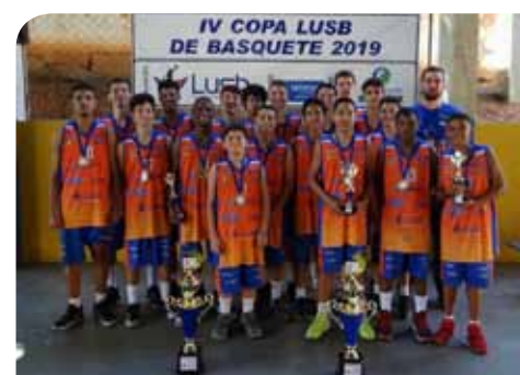
O evento é realizado com apoio da prefeitura, por meio do edital de seleção da Secretaria Municipal de Esporte e Lazer (Semesp)