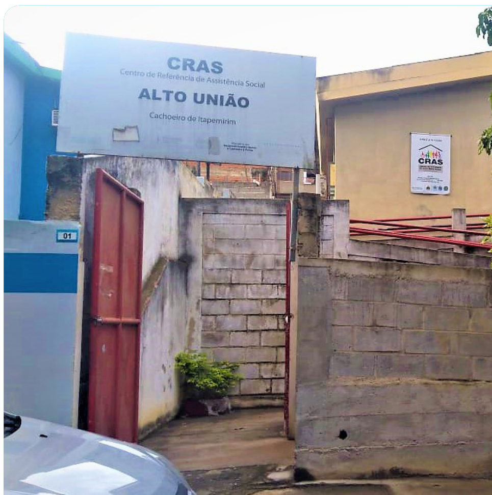
Unidade é referência para famílias de 19 bairros e cinco localidades

Em média, por mês, o Cras do bairro Alto União realiza 350 atendimentos particularizados e 210 atendimentos em grupos. No local, são ofertados o Serviço de Proteção e Atendimento Integral à Família (Paif), o Serviço de Convivência e Fortalecimento de Vínculos (SCFV) e, ainda, o atendimento do Cadastro Único de programas sociais do governo federal.