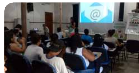
Evento será realizado por meio do programa Acessuas Trabalho

de serviços sociais possam ingressar no mercado de trabalho. As turmas são formadas por homens e mulheres, na faixa etária de 14 a 59 anos, atendidos pelos Centros de Referências de Assistência Social (Cras), Centro de Referência Especializado de Assistência Social (Creas), Centro de Referência da Juventude (CRJ) e outros equipamentos da assistência social.