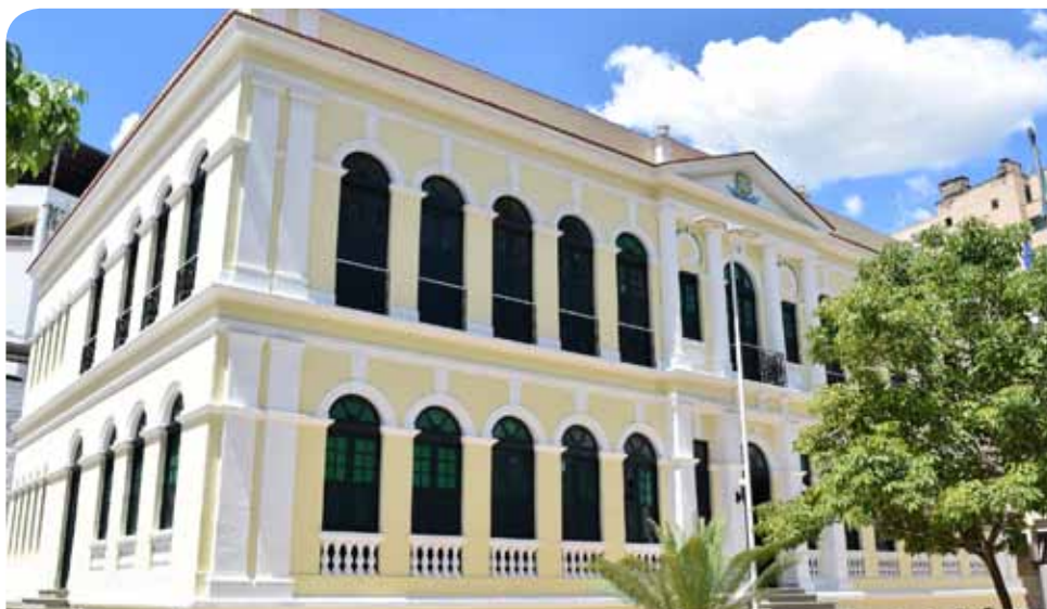
Classificação preliminar é feita com base na declaração de títulos dos candidatos

“O alto número de inscritos corrobora o sentimento da população com relação à lisura e impessoalidade do processo seletivo da prefeitura de Cachoeiro de Itapemirim”, complementa o secretário.