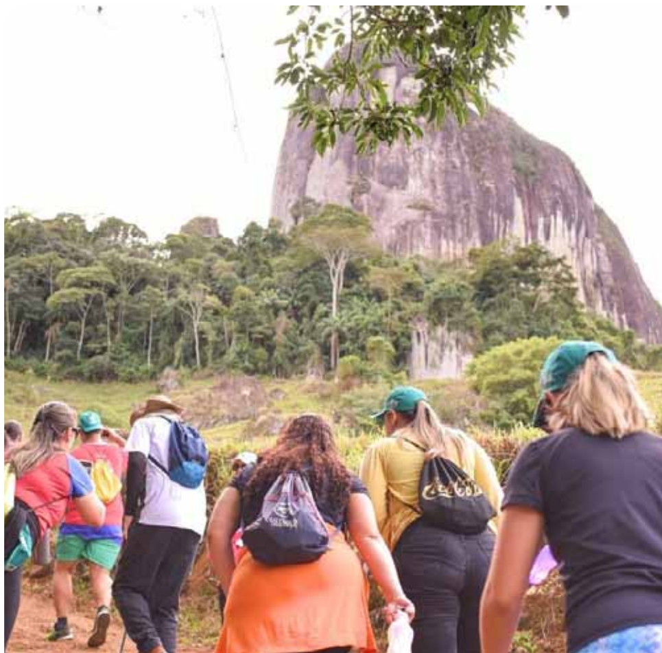
Os participantes tinham como destino final a Pedra da Penha, ponto turístico da região