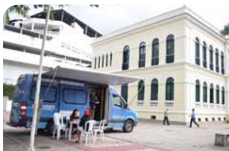
A ação integrada ocorreu na Praça Jerônimo Monteiro, nesta segunda (10)

distribuirá materiais educativos. Realizado também na praça Jerônimo Monteiro, na segunda (10), o atendimento integrado móvel passará, ainda neste mês, pelos bairros Paraíso, Nova Brasília, Rui Pinto Bandeira e Aeroporto. Confira os locais: