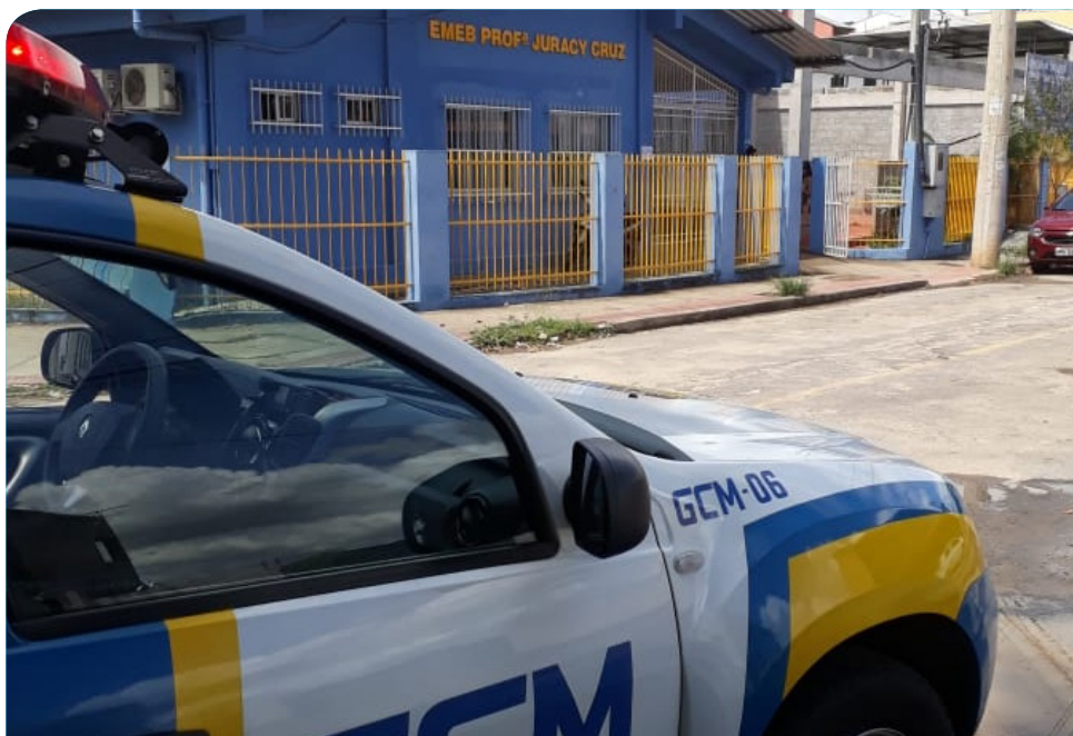
Ronda de Prevenção Escolar passou a contar com o apoio das viaturas da Ronda Municipal Ostensiva

“Nós estamos gostando muito, principalmente,