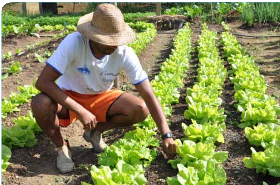
Objetivo é incentivar a emissão de notas, o que ajuda o município e não onera o produtor