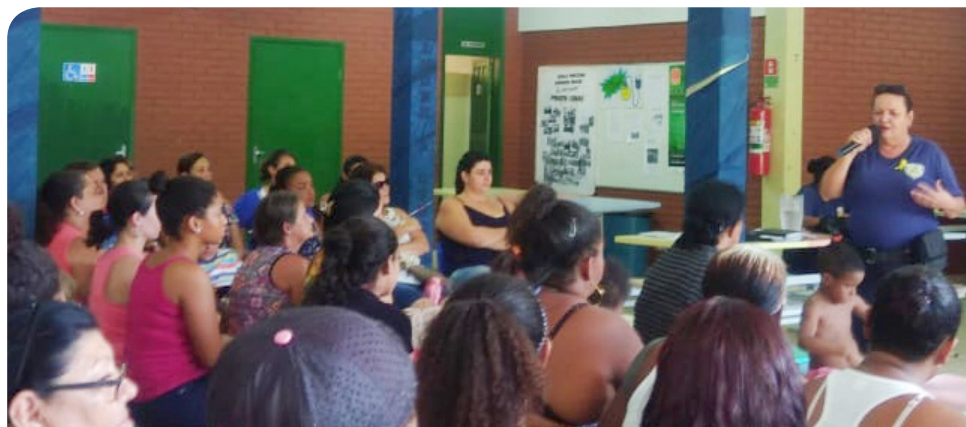
Instituições podem solicitar a atividade à Secretaria Municipal de Segurança e Trânsito

em 2017, com o intuito de atuar no atendimento às mulheres vítimas de violência doméstica e familiar. Atua em parceria com o Poder Judiciário, a Delegacia de Atendimento à Mulher, a Defensoria Pública e as secretarias municipais de Desenvolvimento Social (Semdes) e de Saúde (Semus).