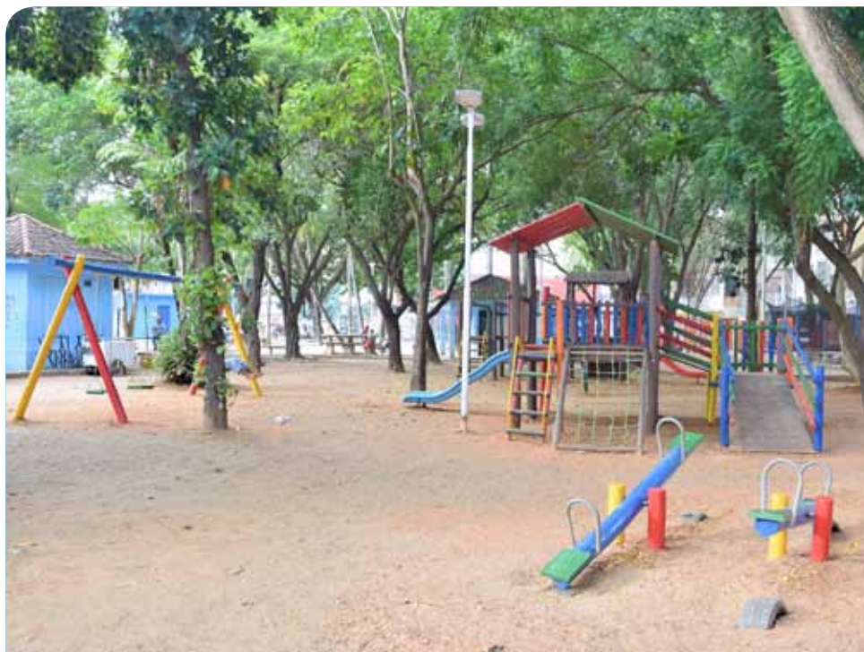
Espaço ainda receberá diversos serviços de manutenção

“A Praça de Fátima é referência para todos os moradores de nossa cidade e muito utilizado para diversas atividades, tanto na área esportiva quanto cultural. Os investimentos da prefeitura