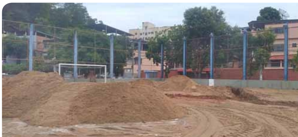
Vai funcionar no campo de areia do bairro, que tem recebido diversas melhorias