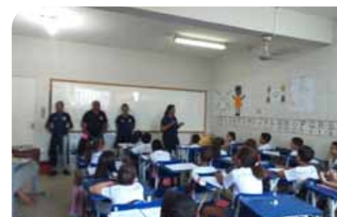
Equipe da Guarda Municipal orientou pais e estudantes sobre o projeto, nesta semana

experiência no interior do município, atendendo aos anseios das famílias de Itaoca. As atividades do projeto vão contribuir de forma muito positiva para a formação cidadã das crianças e adolescentes do distrito”, salienta o secretário de Segurança e Trânsito de Cachoeiro, Ruy Guedes Barbosa Júnior.