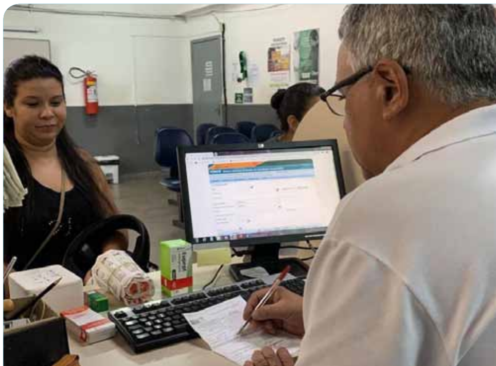
A partir da quinta-feira (2), ela funcionará na rua 25 de Março, Centro

“É de suma importância um local mais amplo para acondicionar os medicamentos e melhor atender à população. O imóvel escolhido, no