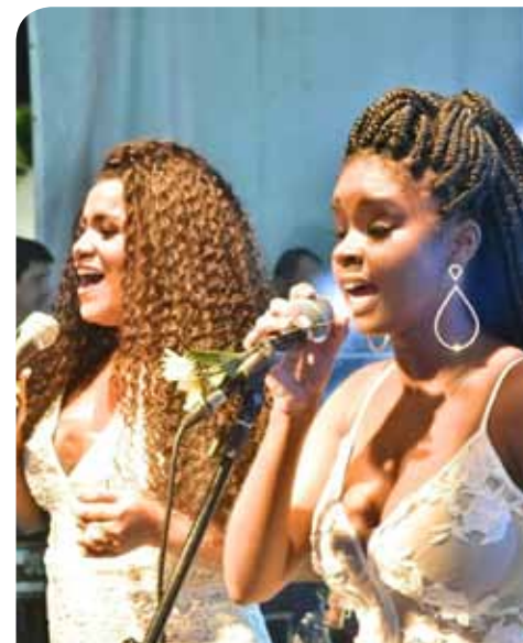
A dupla LILOH, de Cachoeiro, em sua apresentação