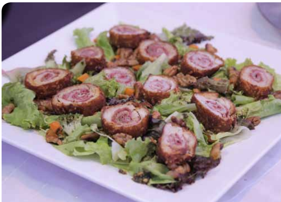
A organização é da Secretaria Municipal de Cultura e Turismo (Semcult)

A relação dos estabelecimentos e dos pratos participantes, com descrição e fotos das iguarias, pode ser conferida no site www.girogastronomico.cachoeiro.es.gov.br .