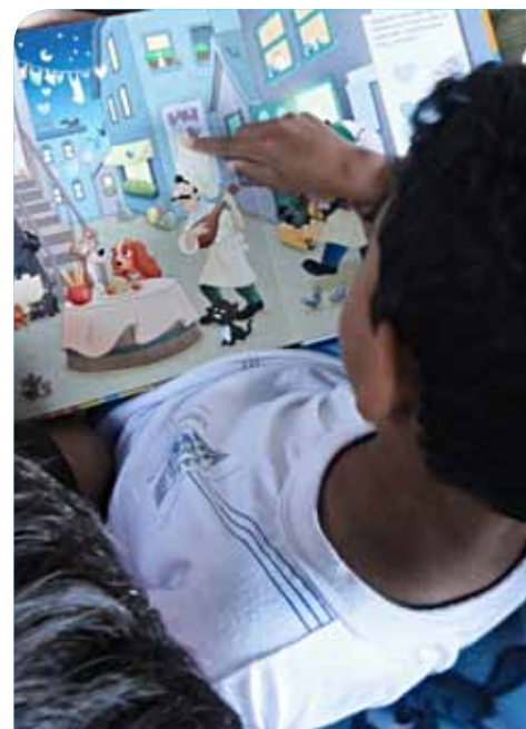
Município vem realizando 100% das ações propostas pela iniciativa

Ao fim da administração, serão avaliados os resultados obtidos em Cachoeiro e, também,