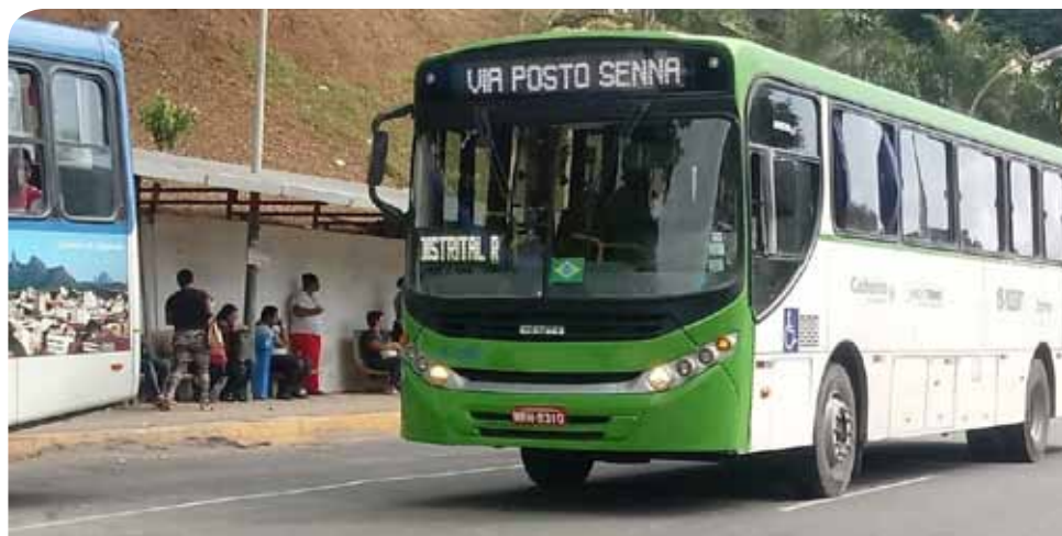
As mudanças foram autorizadas pela Agersa (Agência Municipal de Regulação dos Serviços Públicos Delegados de Cachoeiro de Itapemirim)

basta acessar o site da concessionária Novotrans ( www.novotrans.com.br ) ou consultar os quadros de avisos dentro dos coletivos.