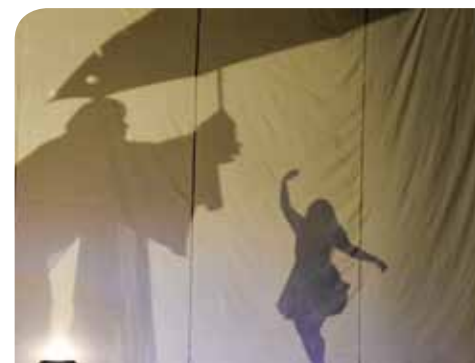
Espectáculo A menina que queria ser estrela é uma das atrações do mês de abril

Encerrando a agenda de abril, no dia 26, às 20h, o público poderá curtir o show de stand up “Vila do Riso” (classificação 14 anos), com o humorista Léo Lins. Os ingressos estarão na faixa de R$ 80,00 (inteira) e R$ 40,00 (meia).