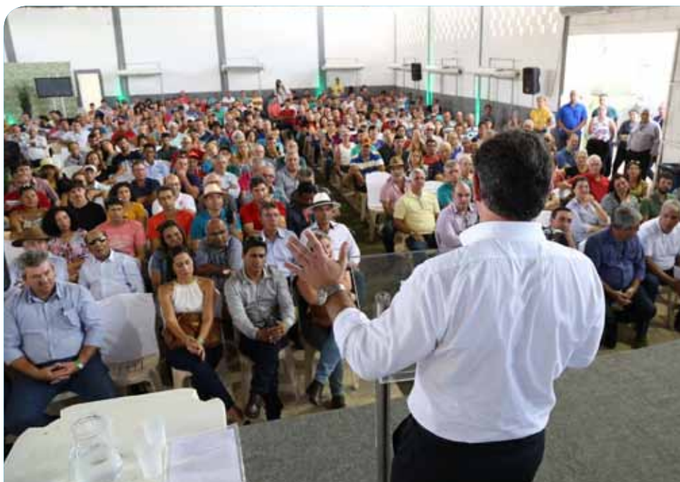
Cadastro deve ser efetuado no site do evento

“A Programação Técnica é um dos destaques da ExpoSul Rural. Procuramos abranger o maior número possível de áreas de interesse dos agricultores e público em geral, que poderão ter contato com especialistas reconhecidos nas esferas estadual e nacional”, explica o secretário municipal de Agricultura e Interior de Cachoeiro,