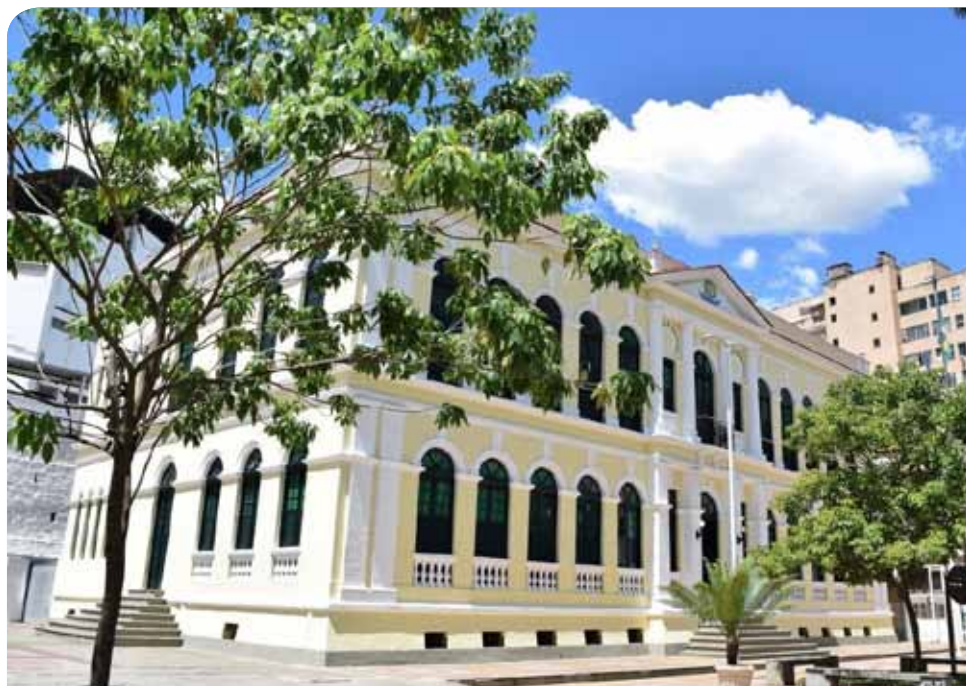
Público que passar pelo local poderá esclarecer dúvidas sobre o transtorno

Nesta segunda-feira (1), na Emeb “Zilma Coelho”, que fica no B. Ferroviários, foi