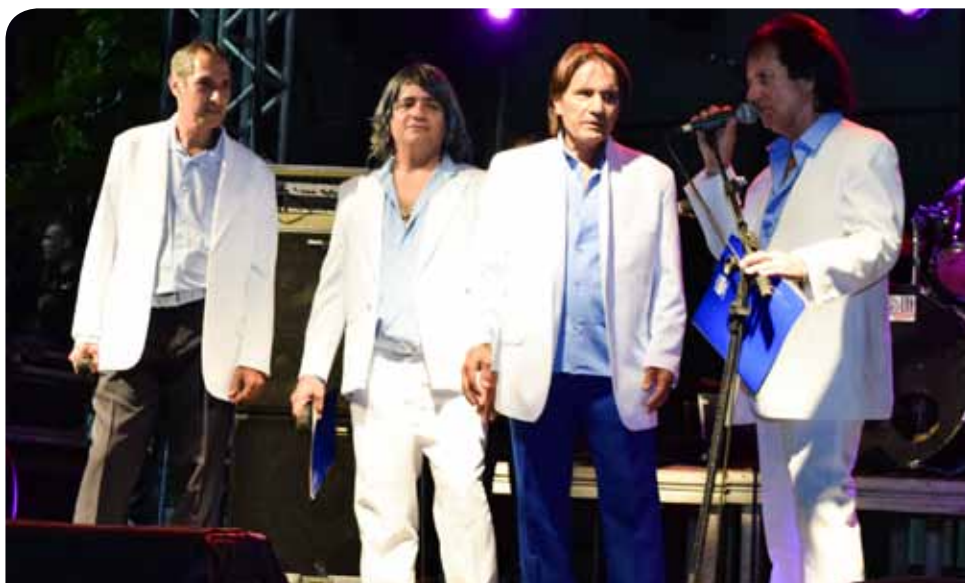
A primeira edição do concurso foi realizada em 2018