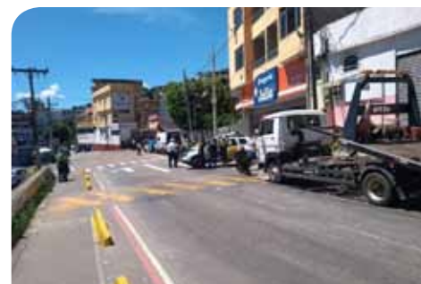
No total, foram abordadas 168 motocicletas, das quais 19 foram removidas

Iniciada em fevereiro, a “Cavalo de Aço” tem como foco a redução dos índices de assaltos em Cachoeiro. Seu principal alvo são as motocicletas, veículos muito utilizados por criminosos para esse tipo de delito.