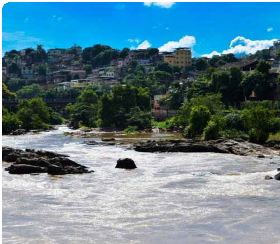
Serão sete dias de atividades de educação ambiental com foco na preservação dos recursos hídricos