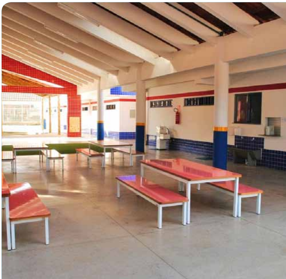
A unidade é a terceira, desse modelo, construída no município

Cachoeiro conta com creches do mesmo modelo nos bairros São Lucas e Boa Vista.