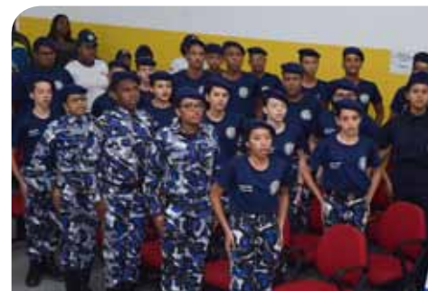
Participantes praticam atividades esportivas, culturais e de cidadania

criança e o adolescente receberão diversas informações bastante úteis para a formação deles como cidadãos. Eles se tornam multiplicadores, disseminadores das boas práticas sociais que aprenderam, tanto nas suas escolas quanto nas comunidades onde vivem”, completa.