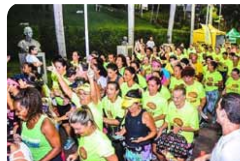
O percurso de 5 km teve início e terminou na Praça Jerônimo Monteiro, no Centro

de saúde gratuitos oferecidos durante o dia, na praça Jerônimo Monteiro. O evento foi preparado em conjunto com as secretarias municipais de Desenvolvimento Social (Semdes), de Saúde (Semus), de Esporte e Lazer (Semesp) e com o Conselho Municipal dos Direitos da Mulher (CMDM). Além disso, teve o apoio da Secretaria Municipal de Segurança e Trânsito (Semset).