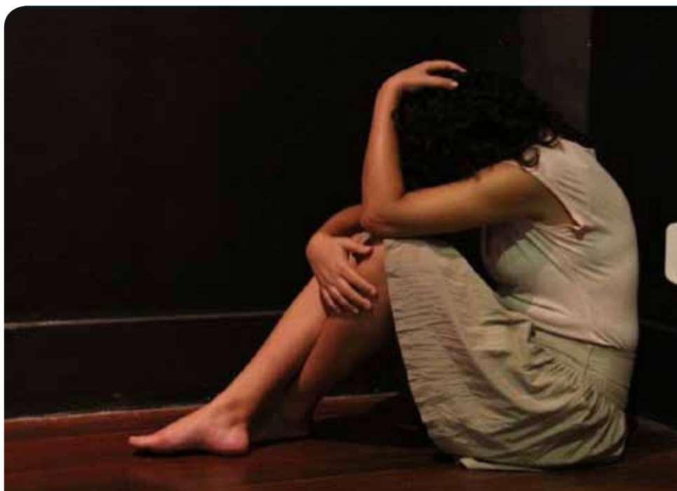
Um dos recursos que serão usados nas atividades é o violentômetro

Um dos materiais que vem sendo trabalhados