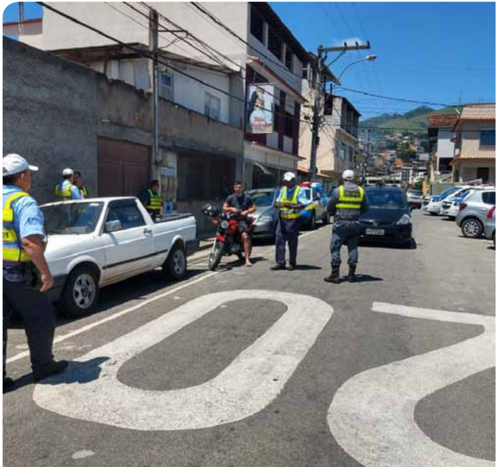
Oito motos foram removidas por irregularidades, nesta sexta (22)