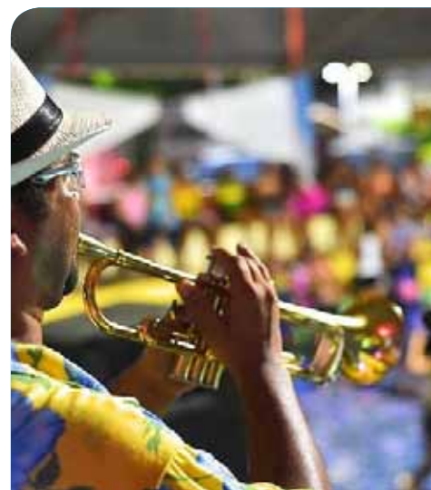
As dicas ajudam ao consumidor a ter dias de folia sem aborrecimentos

- A partir de duas horas, o passageiro pode exigir alimentação. Mais de quatro horas, a companhia tem de disponibilizar acomodação ou hospedagem e transporte. O passageiro, no caso de cancelamento da passagem, também tem