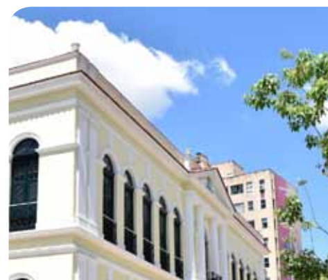
Apresentação dos novos titulares foi realizada na sexta-feira (22)

entre as quais as de pregoeiro municipal, presidente de Comissão Permanente de Licitação, gerente de compras e assessor jurídico.