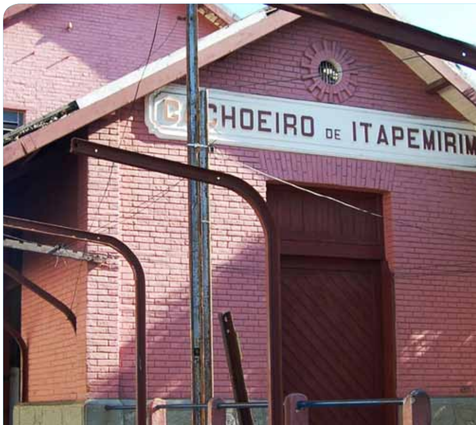
CIT vai funcionar no Museu Ferroviário Domingos Lage