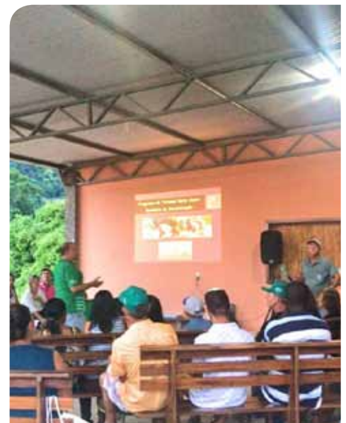
Mais de 40 agricultores das comunidades de Boa Vista e Alto São Vicente participaram

Ainda de acordo com o secretário, a iniciativa contemplará, também, as comunidades rurais de Independência e Bom Jardim. Com o projeto, será criada uma infraestrutura de suporte ao turista, com lanchonetes, pousadas, guias turísticos e transporte.