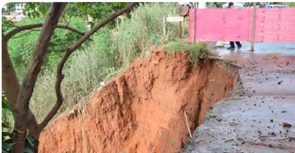
A via, que vem sofrendo com o processo erosivo, será recomposta

Além das intervenções na via Santo Francisco Cypriano, o bairro Coramara recebe obras de extensão da rede de drenagem na rua Paulina Vieira Bueno, para melhorar a captação de águas pluviais, com vistas a reduzir os riscos de alagamento e outros transtornos.