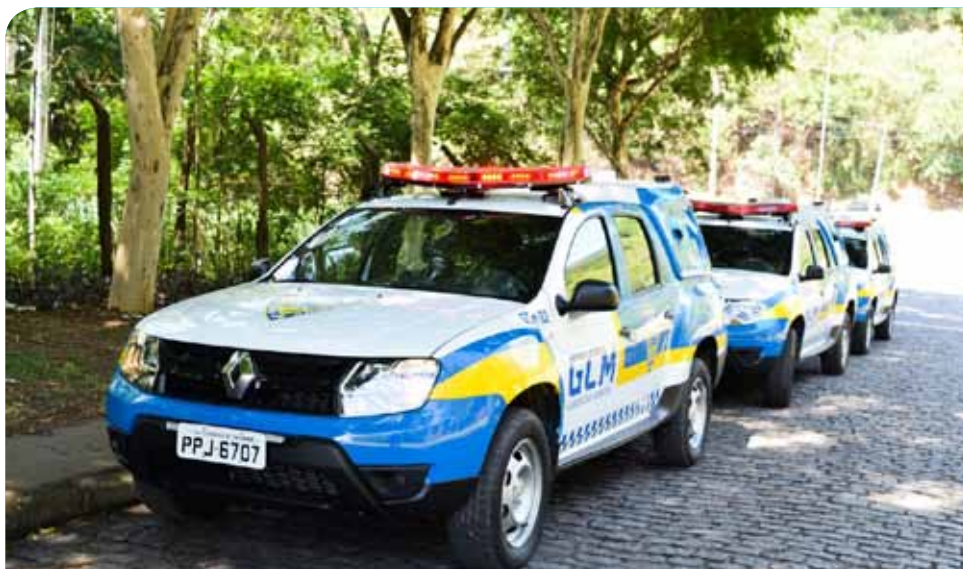
As operações começam já nesta semana e serão realizadas diariamente

“Essa interação será essencial para a inibição desses tipos de crime. Parabéns ao município por assumir e fazer sua parte”, completou o comandante Rubim.