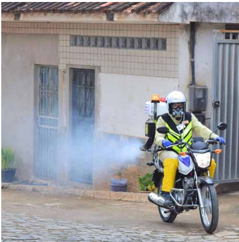
O trabalho será realizado entre os dias 1 e 18 de fevereiro

no momento de aplicação da fumaça com o inseticida, abram os imóveis para melhor resultado, e que procurem ficar em um lugar bem arejado.