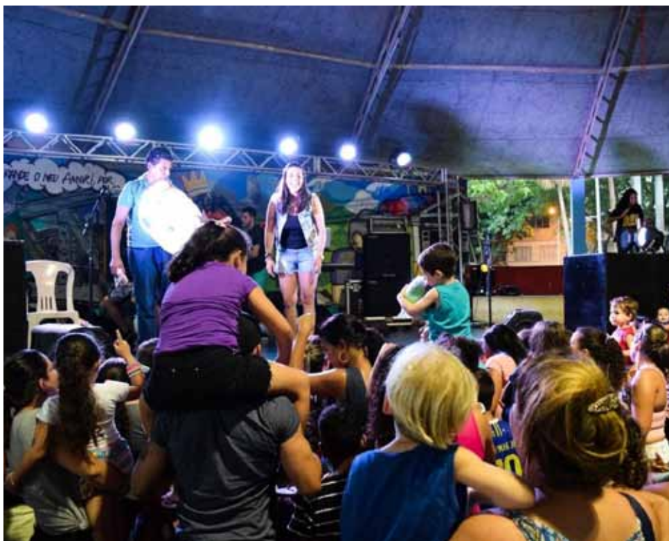
Projeto é realizado nas manhãs de domingo, no Circo da Cultura

O projeto também incentiva o hábito da leitura. Para aqueles que desejam expandir o repertório literário, na geloteca (geladeira que foi transformada numa pequena biblioteca) e