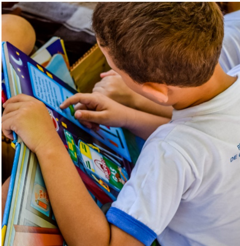
Foram investidos R$ 6,8 milhões a mais do que em 2017

Cachoeiro também aumentou a aplicação dos recursos oriundos do Fundo de