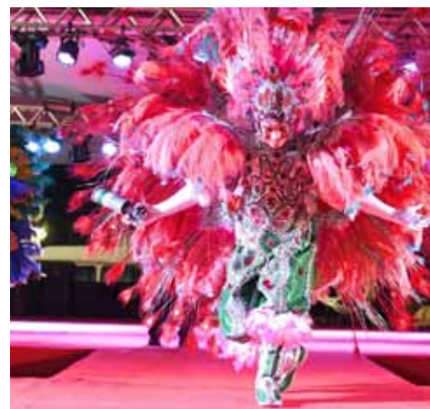
Um dos concursos é o de fantasias carnavalescas

As informações detalhadas sobre como participar de cada um desses concursos estão nos seus respectivos editais, disponíveis no site da prefeitura ( www.cachoeiro.es.gov.br ). Para acessá-los, basta clicar, sequencialmente, nas abas ‘Secretaria’, ‘Cultura e Turismo’ e ‘Editais’. Mais informações podem ser obtidas pelo telefone (28) 3155-5334.