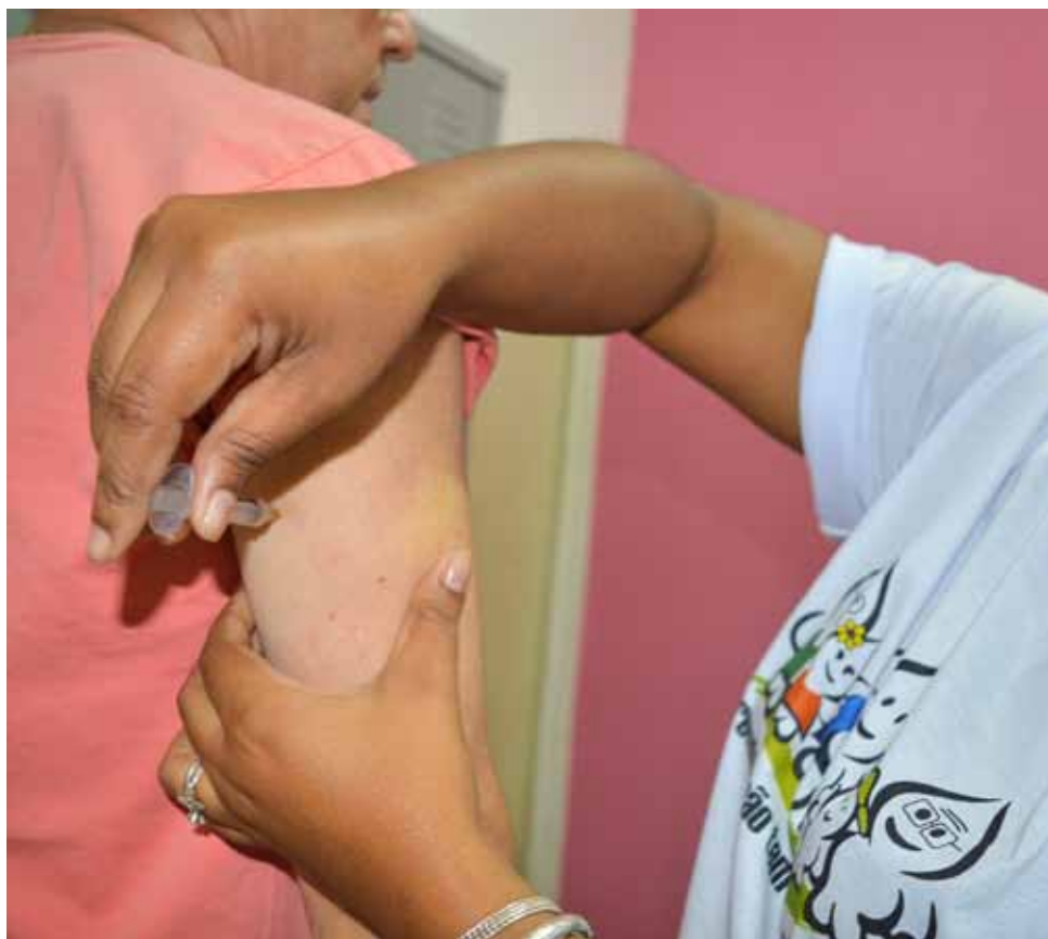
Será nesta quarta-feira (30), das 8h às 11h, no encerramento da campanha Janeiro Branco

Na terça (29), véspera do Dia D na praça, a UBS do bairro BNH de Baixo vai disponibilizar aos moradores da região, a partir das 13h, atendimento médico individual em saúde mental.