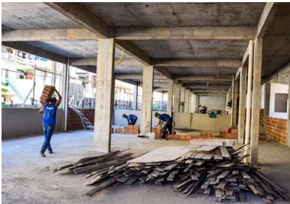
A escola Olga Dias, em construção no Cel. Borges, foi uma das visitadas; será a maior unidade da rede municipal

Recebeu visita, ainda, a nova escola Olga Dias, no bairro Coronel Borges, que é erguida com recursos próprios da prefeitura, que chegam a R$ 4 milhões. A previsão é de que o prédio, que será o maior da rede municipal, fiquem pronto até maio.