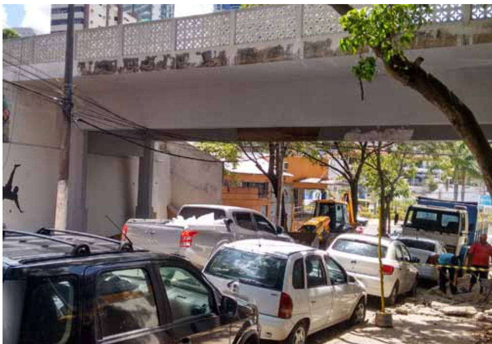
Via vai ganhar intervenções artísticas e uma calçada da fama com nomes de ex-jogadores

de Cachoeiro estão sendo revitalizadas pela prefeitura. A praça Visconde de Matosinhos, nas proximidades do Museu Ferroviário Domingos Lage (antiga estação), ganhará ampla calçada; paisagismo com plantas e outros elementos ornamentais; melhorias na iluminação e um ponto de apoio para órgãos de segurança e serviços de emergência. Além disso, peças remanescentes do viradouro da antiga ferrovia, aterrado no local, serão recuperadas.