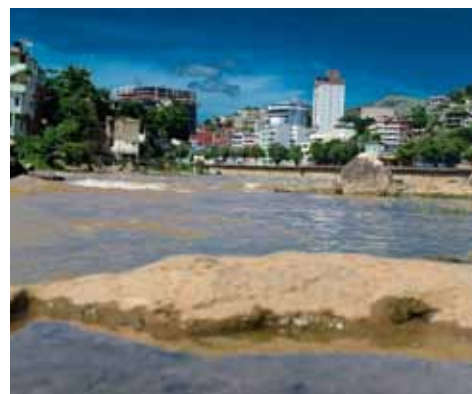
Mesmo nos pontos de aparente mansidão das águas, há risco de afogamento

não exagerar na ingestão de bebidas alcoólicas são dicas fornecidas pela Defesa Civil.