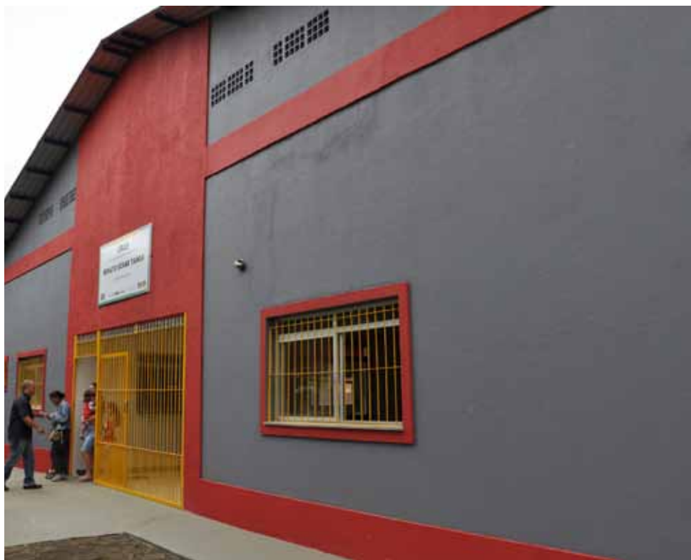
O cadastramento pode ser feito nos Cras, como o de Jardim Itapemirim, e na Central do Cadastro Único

O BPC é a garantia de um salário-mínimo mensal ao idoso com 65 anos ou mais e ao cidadão com deficiência física, mental, intelectual ou sensorial de longo prazo, que o impossibilite de participar, de forma plena e efetiva, na sociedade, em igualdade de