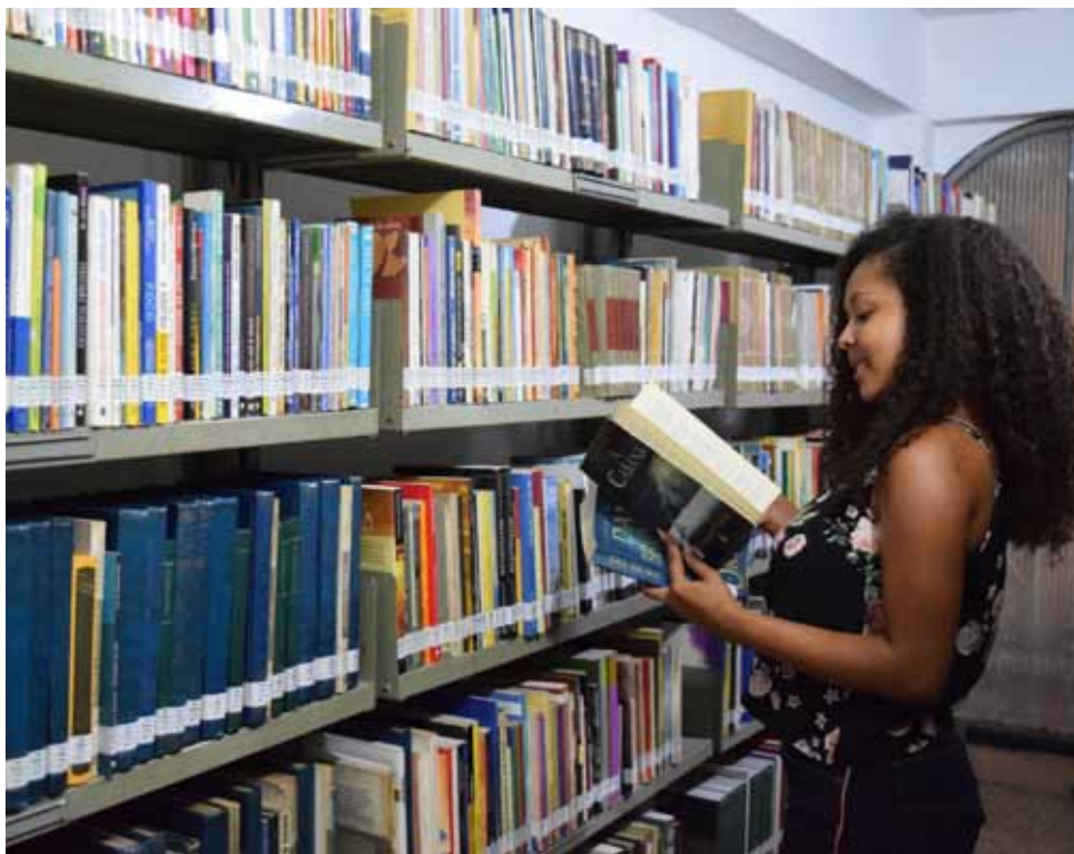
Na biblioteca há centenas de exemplares, o que cativa um público fiel aos livros

“Tenho alguns autores especiais: Stephen King, Anne Rice, mas também gosto muito de histórias que retratam a segunda guerra mundial e as crônicas, como Game of Throne,