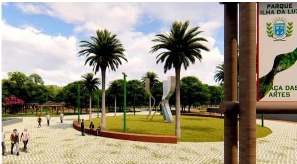
Projeto foi apresentado em reunião na tarde desta quarta-feira (5)