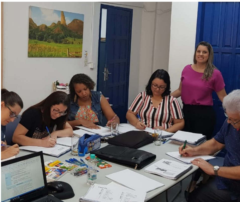
Equipe que implantará modelo Escola da Escolha participou de formação nesta semana

“Com o apoio do ICE e de entidades parceiras nessa iniciativa, fortaleceremos o programa municipal de educação integral, que começamos a implantar neste ano. O modelo de Escola da Escolha tem alcançado resultados excelentes Brasil a fora, aferidos, inclusive, pelo Índice de