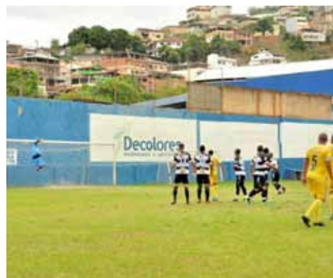
Na final do campeonato de futebol, tem equipe com chance de bicampeonato