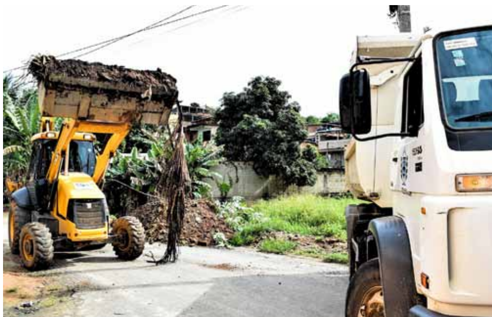
O mutirão faz parte de acordo de cooperação técnica para revitalização dos córregos de Cachoeiro