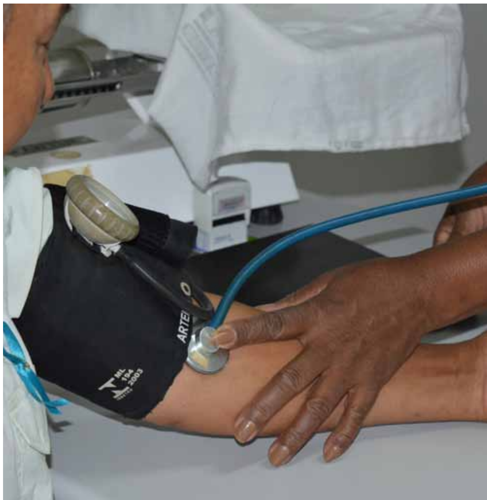
Muitos outros serviços serão oferecidos ao público masculino, na ocasião

Das 8h às 12h, estarão disponíveis as vacinas contra HPV (para meninas de 9 a menores de 15 anos e meninos de 11 a menores de 15 anos), Meningite (para meninas e meninos de 11 a menores de 15 anos), febre amarela (maiores de 9 meses), Hepatite B, além da triplice viral (sarampo, caxumba e rubéola; até 49 anos), dupla ou DT (tétano e difteria) e vacinas de rotina para crianças menores de 1 ano.