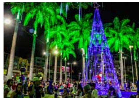
“O Natal Transforma” é o tema da programação deste ano

alimentação, com food trucks e carrinhos de pipoca e churros. O Concerto de Natal, um dos momentos mais esperados pelo público, será protagonizado nos dias 21 e 22 de dezembro pela Orquestra Sinfônica Sul do ES (Osses) e grupos corais.