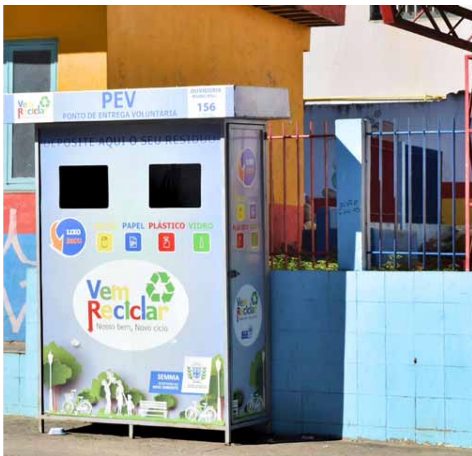
A destinação adequada de materiais recicláveis é uma das ações previstas no documento