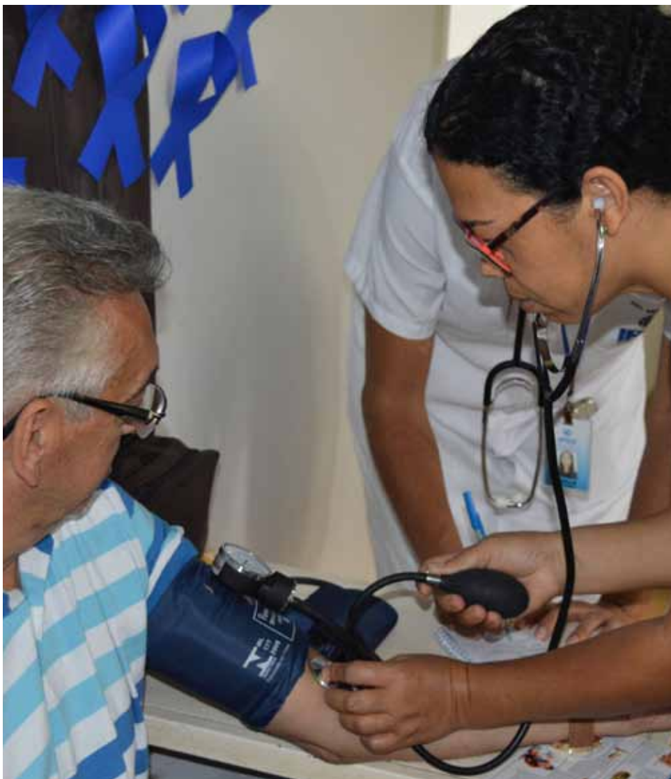
Há vagas para consultas com urologista, clínico geral, psicólogo e outros profissionais