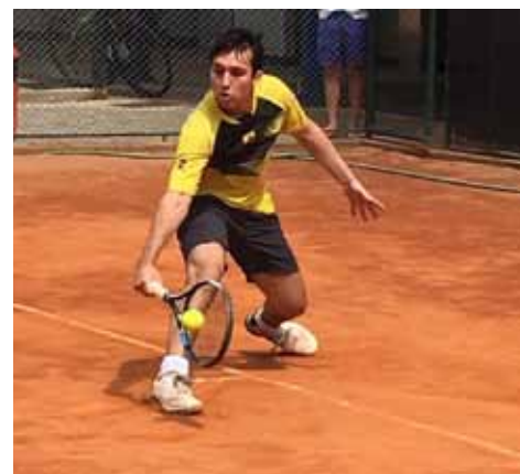
Torneio será realizado neste mês e tem 50 vagas para competidores.

vistas a inserir a modalidade no projeto, futuramente.