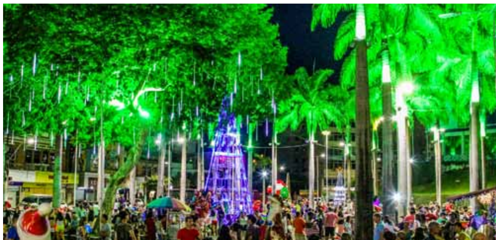
Comerciantes devem se inscrever para atuar na praça Jerônimo Monteiro de 24 deste mês a 6 de janeiro

Também não vão faltar os demais elementos que encantaram no ano passado: uma grande árvore de natal (14 metros), casa do Papai Noel, presépio, trenó, renas, soldados de chumbo, bolas e presentes decorativos e muita iluminação nas árvores e no Palácio “Bernardino Monteiro”, que está ganhando nova pintura.