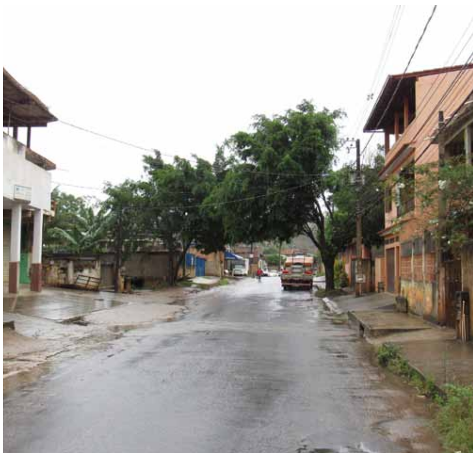
As intervenções têm por objetivo substituir 563 metros de redes antigas