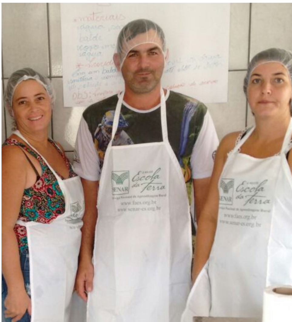
A capacitação teve início nesta segunda-feira (22) e segue até quarta (24)

Desde janeiro deste ano produtores rurais do município têm participado do curso Boas Práticas de Fabricação e novas capacitações serão oferecidas em breve. Os interessados já podem fazer suas inscrições na Semai. Mais informações pelo telefone 3155-5359.