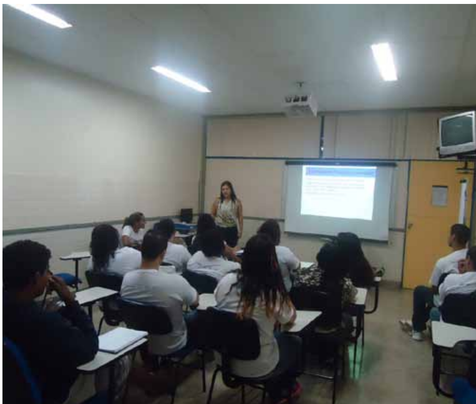
Serão oferecidos 28 cursos a pessoas já atendidas pelo Acessuas Trabalho

Entre as oficinas que serão ofertadas estão as de informática básica, técnicas de recepção e secretariado, marketing pessoal, moda e estilo, vendas, dentre outros temas. O início das atividades está previsto para a segunda quinzena