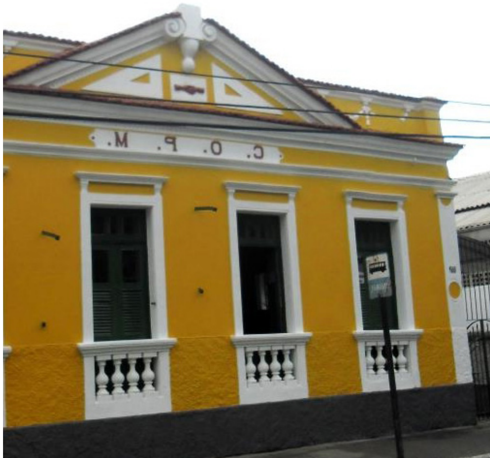
Evento segue até domingo (28), com espetáculos teatrais e de dança, em diversos locais

Segue, nesta terça-feira (23), a programação do VII Festival de Artes Cênicas de Cachoeiro de Itapemirim (Facci), organizado pela Secretaria Municipal de Cultura e Turismo (Semcult). O palco, neste dia, será o Centro Cultural Nelson Sylvan, na rua 25 de Março (ao lado do Centro Operário e de Proteção Mútua e próximo à Casa dos Braga).