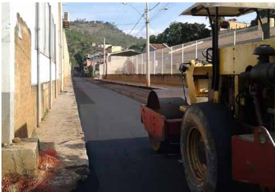
Diversas regiões do município foram atendidas com os serviços

Contudo, a previsão é de que o asfaltamento, feito com recursos do Ministério das Cidades, seja concluído ainda nesta semana, se não houver chuva nos próximos dias.