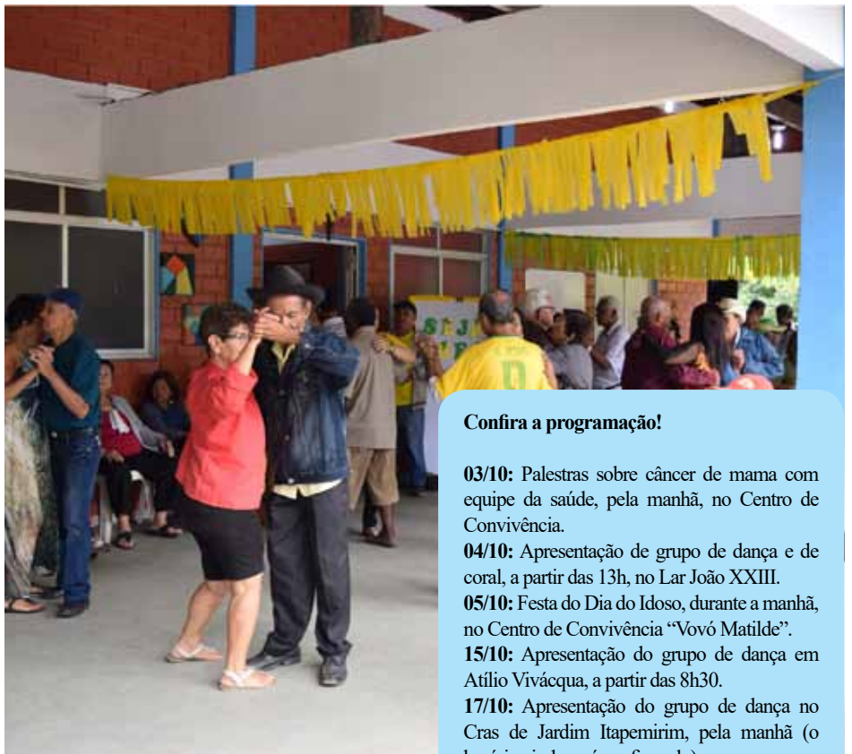
Referência em atividades para os idosos, o local passou por revitalização neste ano

Mantido e administrado pela Secretaria Municipal