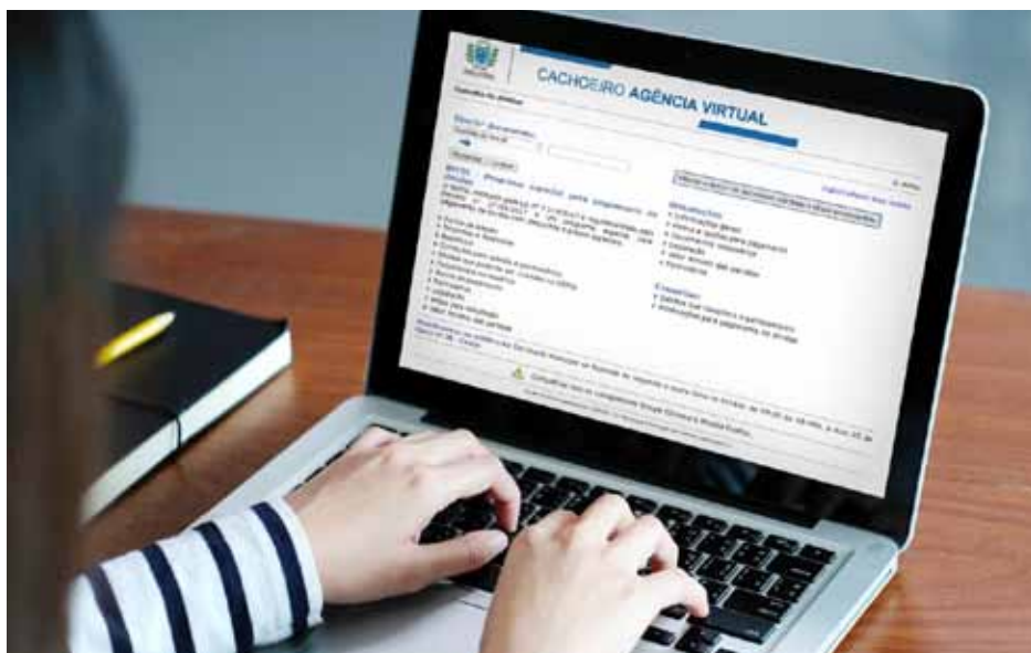
O parcelamento pode ser feito com as condições do Refis, pela Agência Virtual

Na Agência Virtual, também há informações detalhadas sobre o Refis e os procedimentos de parcelamento e pagamento. Quem ainda preferir o atendimento presencial pode se dirigir à Semfa, localizada na rua 25 de Março, 28/38, Centro. O funcionamento é de segunda a sexta, das 9h às 18h, e o atendimento pode ser agendado pela internet, por meio do site agendamento.cachoeiro.es.gov.br .