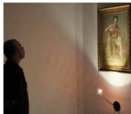
Podem concorrer, às três vagas, profissionais com experiência em artes plásticas e nível superior.