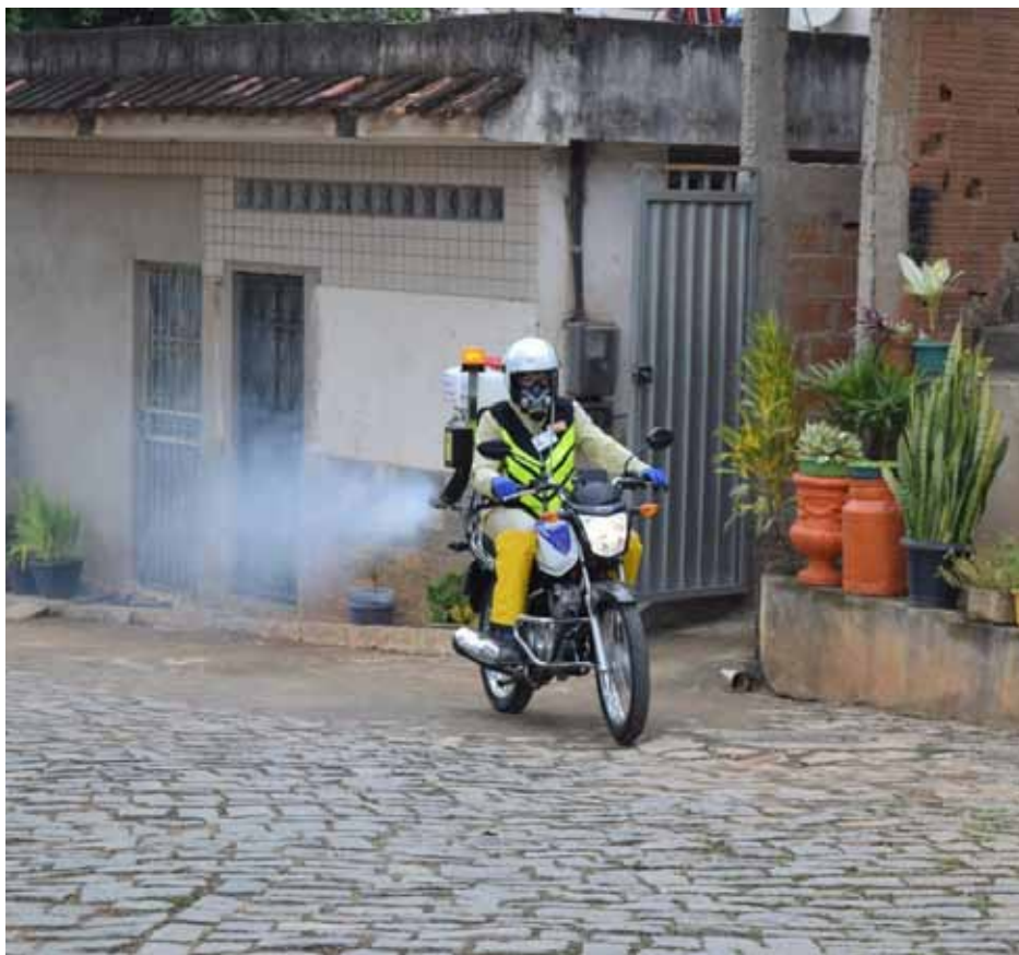
Ações seguem cronograma da Vigilância Ambiental, que dá prioridade aos locais com maior infestação

Além disso, as aplicações de inseticida por meio de bomba costal continuam, sobretudo, nos locais com notificações de zika, dengue e chikungunya, aumentando, gradativamente, a