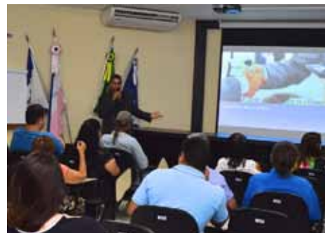
Eles participaram do ciclo de palestras do projeto Vivacidade, concluído nesta segunda (24)

A carteira é um documento de identificação válido em todo o território nacional. Não tem custos de anuidades ou taxa de adesão e permite benefícios para a classe, como participação em feiras dentro e fora do estado.