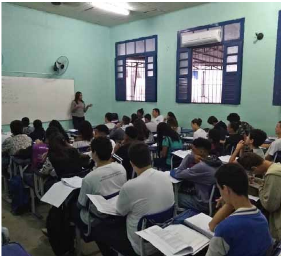
Ao todo, foram 16 aulas aos sábados, resultando em 72 horas de aprendizagem extra

Os últimos encontros foram destinados a um seminário de orientação profissional e à aplicação de um simulado, posteriormente, corrigido pelos professores na presença dos