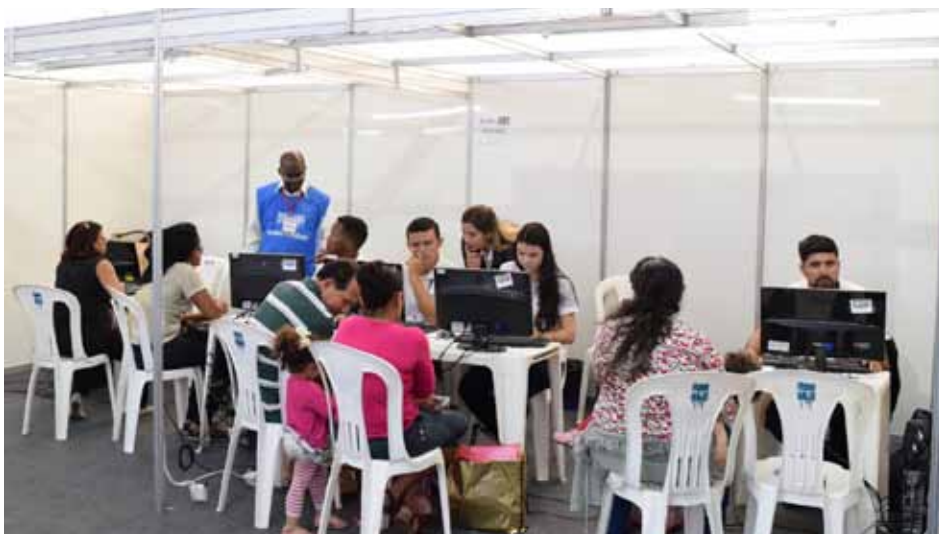
No primeiro dia do evento, foram feitos 458 atendimentos

“O mutirão teve início na data em que o código de Defesa do Consumidor completa 28 anos, uma ocasião especial. O evento é uma oportunidade excelente para conseguir condições vantajosas para eliminar dívidas, mas não se limita a isso. O objetivo