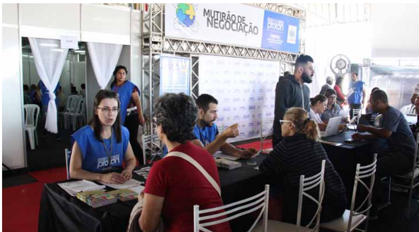
Uma das negociações mais expressivas foi a de uma dívida quitada com 98,27% de desconto

Por meio do 4º Mutirão de Negociação de Dívidas, o Procon de Cachoeiro realizou 746 atendimentos cujos passivos, somados em mais de R$ 1,8 milhão, foram reduzidos para cerca de R$ 385 mil, o que representou uma economia, de aproximadamente, R$ 1,4 milhão (78, 69%).