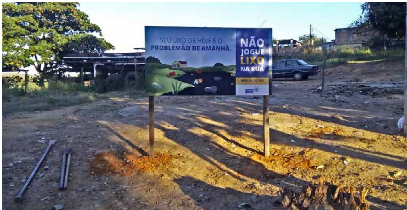
Placa de conscientização produzida com material reaproveitado foi instalada no local

A prefeitura de Cachoeiro, por meio da Secretaria Municipal de Serviços Urbanos (Semsur), realizou, na última sexta-feira (20), um trabalho de limpeza em um ponto de descarte irregular de lixo e entulho na rua Luiz Gonzaga de Oliveira, no bairro São Luiz Gonzaga. Ação partiu de uma demanda dos moradores da região.