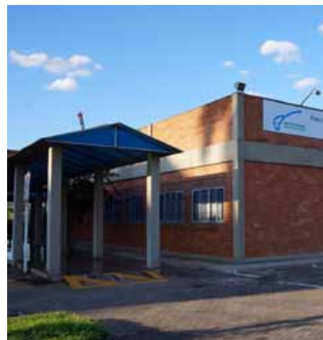
Polo UAB de Cachoeiro tem 40 vagas para curso Ead em Educação, Pobreza e Desigualdade Social

Para mais informações, entre em contato com o Polo UAB de Cachoeiro, pelo telefone (28) 3521-3938 (atendimento de segunda a sexta-feira, das 13h às 22h).