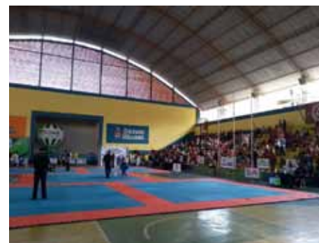
Crianças e adultos participaram da competição

Esportivo foi uma realização da Federação Capixaba de Jiu-Jitsu Esportivo (Fcjje) e contou com o apoio da Secretaria Municipal de Esporte e Lazer (Semesp).