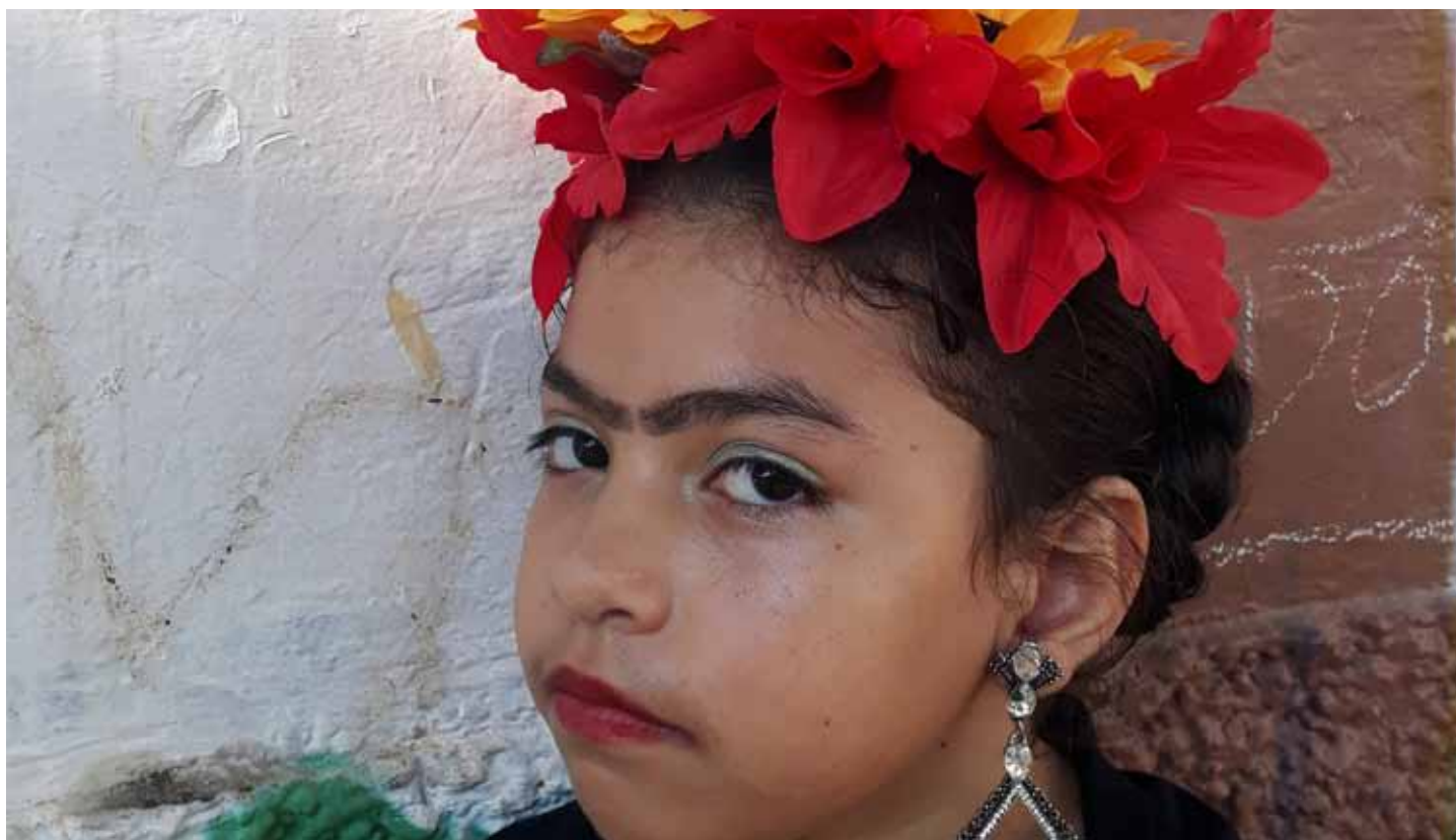
O evento de abertura será na sexta (6), às 9h30, e a mostra ficará em cartaz até 31 de agosto

Em Cachoeiro, cerca de 200 alunos da escola municipal “Valdy Freitas”, do bairro Paraíso, estão fazendo arte. E irão expô-la, também. Cerca de 30 obras produzidas por eles, por meio do projeto “Meu Olhar”, desenvolvido na unidade de ensino, estarão à mostra a partir desta semana, no Museu Ferroviário “Domingos Lage” (antiga estação), na Linha Vermelha, Centro.