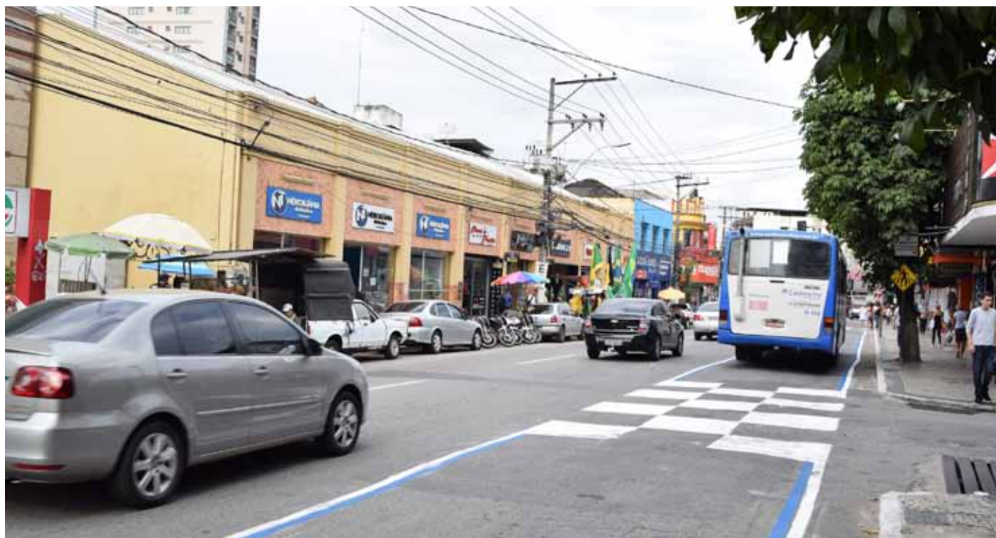
A faixa exclusiva começou a valer na Bernardo Horta nesta quarta-feira (4)

Cachoeiro já conta há alguns anos com as faixas ou corredores prioritários para ônibus. Agora, ganha seu primeiro corredor exclusivo. A novidade é válida desde a manhã desta quarta-feira (4), após pintura na rua Bernardo Horta, uma das mais movimentadas da cidade.