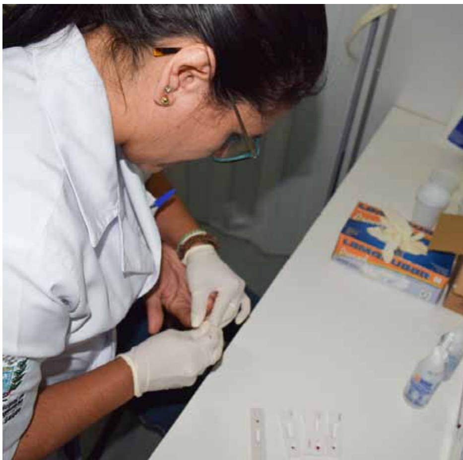
Para este mês, está programado um total de sete visitas.

Museu Ferroviário Domingos Lage: dia 17 (terça-feira), com atendimentos voltados a pessoas em situação de rua