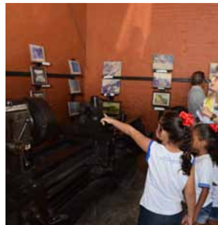
Atualmente, espaço abriga a exposição Meu pequeno Cachoeiro, com trabalhos de estudantes

Ela avalia, também, que os números devem melhorar ainda mais neste mês, por conta da Semana dos Museus e da 7ª Bienal Rubem Braga. “Ambos os eventos, promovidos em maio, colaboraram para a divulgação do espaço. E acreditamos que os novos horários de funcionamento também contribuíram. Esperamos continuar aumentando esses números”, finaliza.