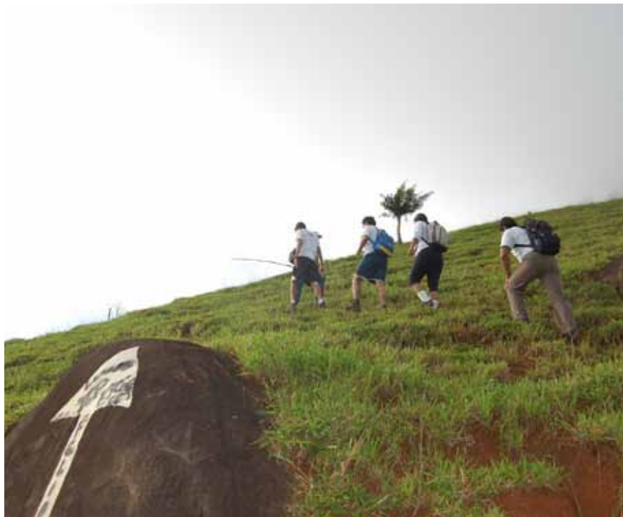
No próximo dia 10 tem caminhada até nascente no bairro São Geraldo, com vista para a Pedra do Caramba

“Buscamos diversificar as ações em comemoração ao Dia Mundial de Meio Ambiente, e as equipes atuarão junto a crianças, adultos e idosos. A expectativa é conseguir