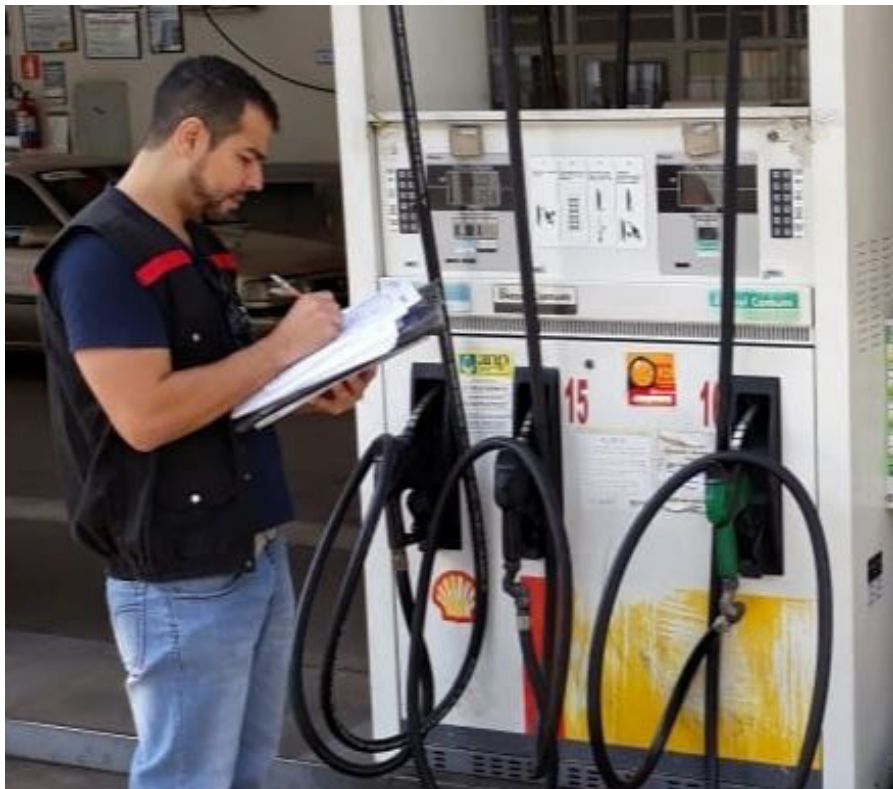
Procon está fiscalizando os preços praticados nos postos após movimento de caminhoneiros

Tendo isso em vista, a atuação do Ministério Público se dá no sentido de acompanhar os trabalhos de fiscalização do órgão de defesa do consumidor e dar andamento aos procedimentos legais, caso sejam encontradas irregularidades – algo que não se restringe apenas aos postos