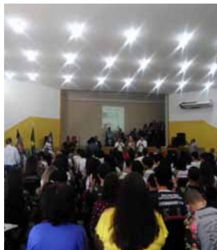
Antes de iniciar atividades, eles participaram de aula inaugural, no último dia 19