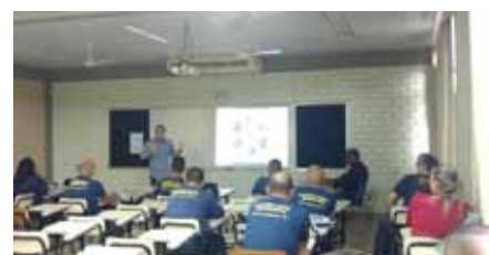
Capacitação realizada pela Acedemia de Polícia Civil se aproxima da reta final

Com a conclusão do curso e os atuais procedimentos da Secretaria Municipal de Segurança e Trânsito (Semset) para emissão dos portes de arma, em convênio com a Polícia Federal, serão cumpridas as exigências legais para que os guardas voltem a portar armas de fogo – o que está previsto para acontecer nos próximos meses.