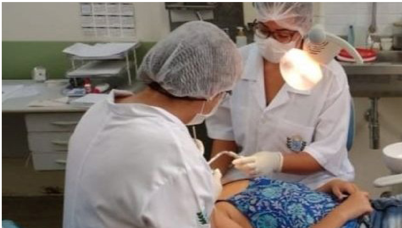
Ações são alusivas ao Dia Mundial de Combate ao Câncer Bucal e ao Fumo (31 de maio)

Na próxima terça-feira (29), a Secretaria de Saúde de Cachoeiro de Itapemirim (Semus) estará na praça Jerônimo Monteiro, na região central da cidade, para conscientizar a população sobre o câncer de boca e a importância de sua prevenção. As atividades são alusivas ao Dia Mundial de Combate ao Câncer Bucal e ao Fumo (31 de maio).