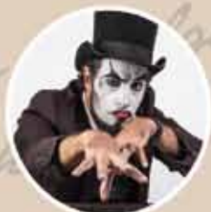
O TEATRO MÁGICO