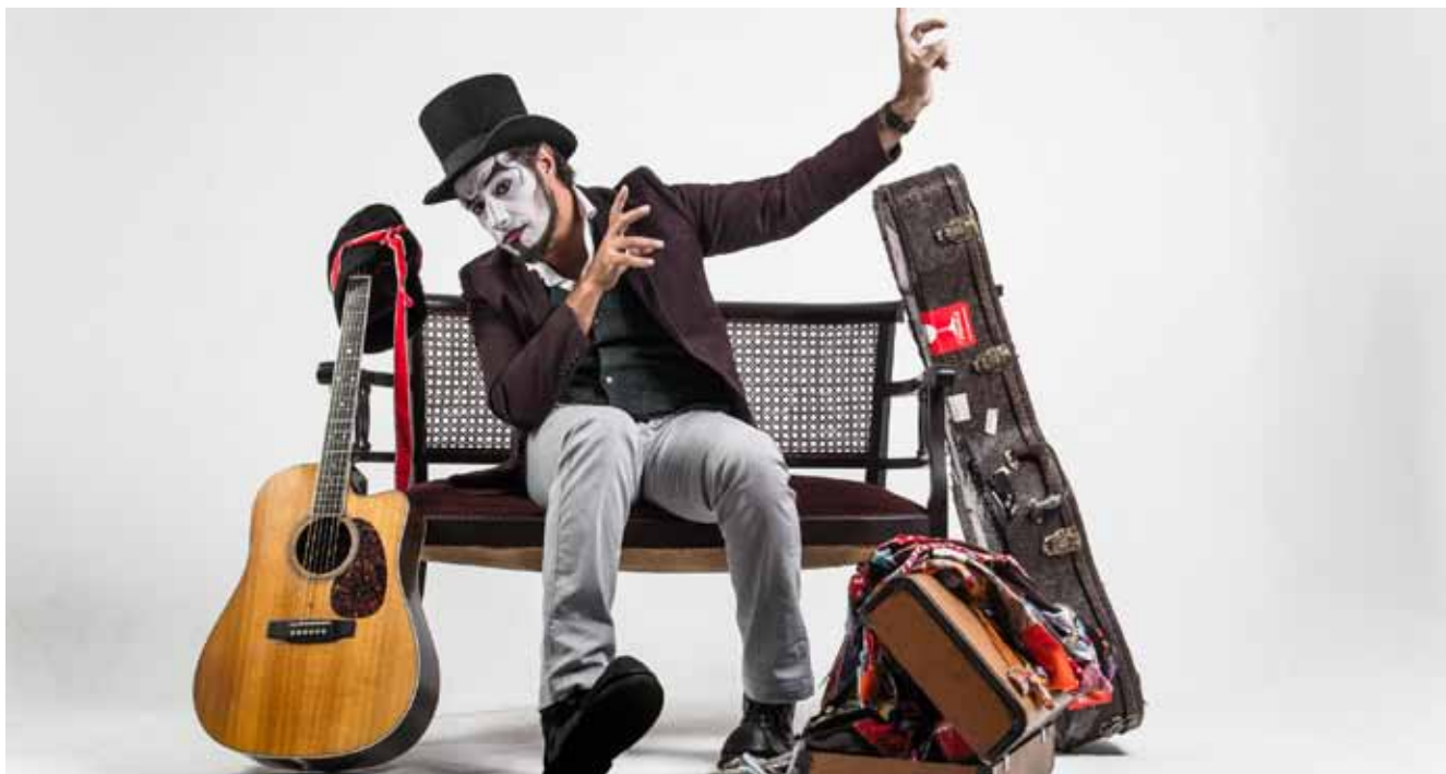
Fernando Anitelli traz versão voz e violão de O Teatro Mágico

Além da vasta programação voltada à literatura, esta edição da Bienal Rubem Braga terá opções de entretenimento em outras artes, como a música. Serão sete atrações em seis dias, entre elas duas de fora do estado: o cantor e ator Jackson Antunes e o grupo O Teatro Mágico, em versão voz e violão.