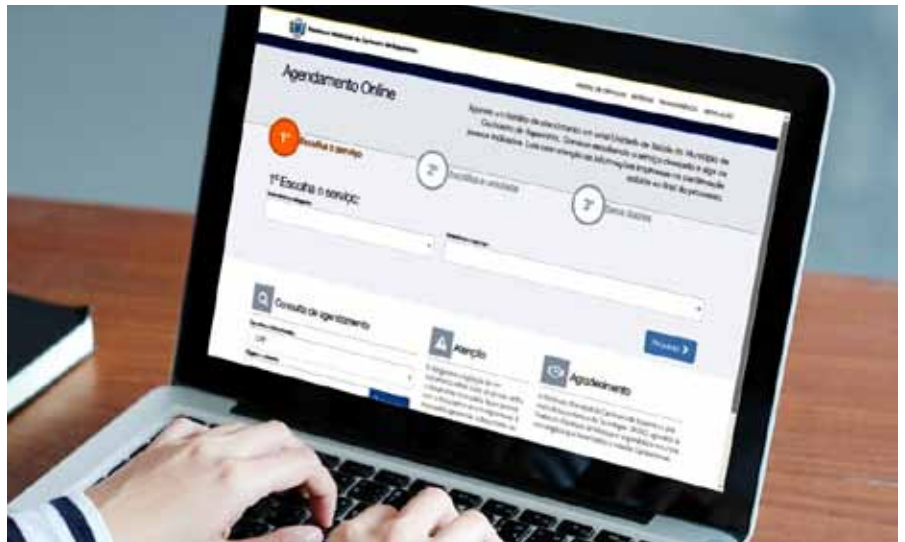
Puericultura é direcionada a crianças de 0 a 9 anos, tendo consultas periódicas de avaliação

Para fazer o agendamento, basta entrar no site