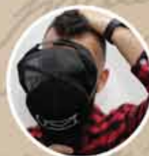
PEDRO "UM CARTÃO" (ESCRITOR)

Faça sua inscrição: bienalrubembraga.cachoeiro.es.gov.br