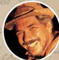
JACKSON ANTUNES (ATOR E CANTOR)