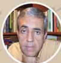
JOSÉ CASTELLO (ESCRITOR)