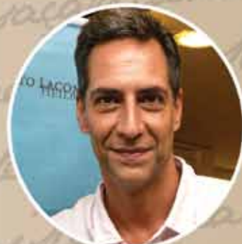
LUÍS ERNESTO LACOMBE (ESCRITOR)