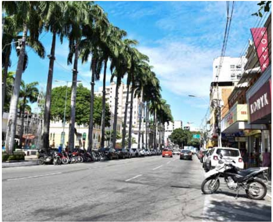
A programação em Cachoeiro inclui orientações na praça a partir desta segunda (14)

Na sede do Sebrae, na avenida Beira Rio (próximo à Polícia Militar), tem oficinas e cursos gratuitos durante a programação. As inscrições podem ser feitas, também, na Sala do Empreendedor, que fica no térreo do