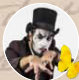
O TEATRO MÁGICO