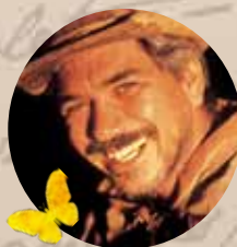
JACKSON ANTONES (ATOR E CANTOR)