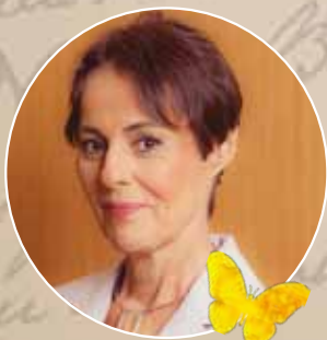
ANA DE HOLLANDA (ESCRITORA)