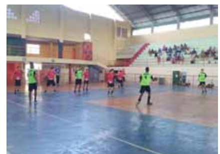
Participam, no total, 14 escolas. Basquete, futsal e handebol são as modalidades disputadas

individuais de atletismo, badminton, judô, tênis de mesa e vôlei de areia. A data está agendada para 25 de maio, e os locais serão confirmados, nos próximos dias, pela Semesp.