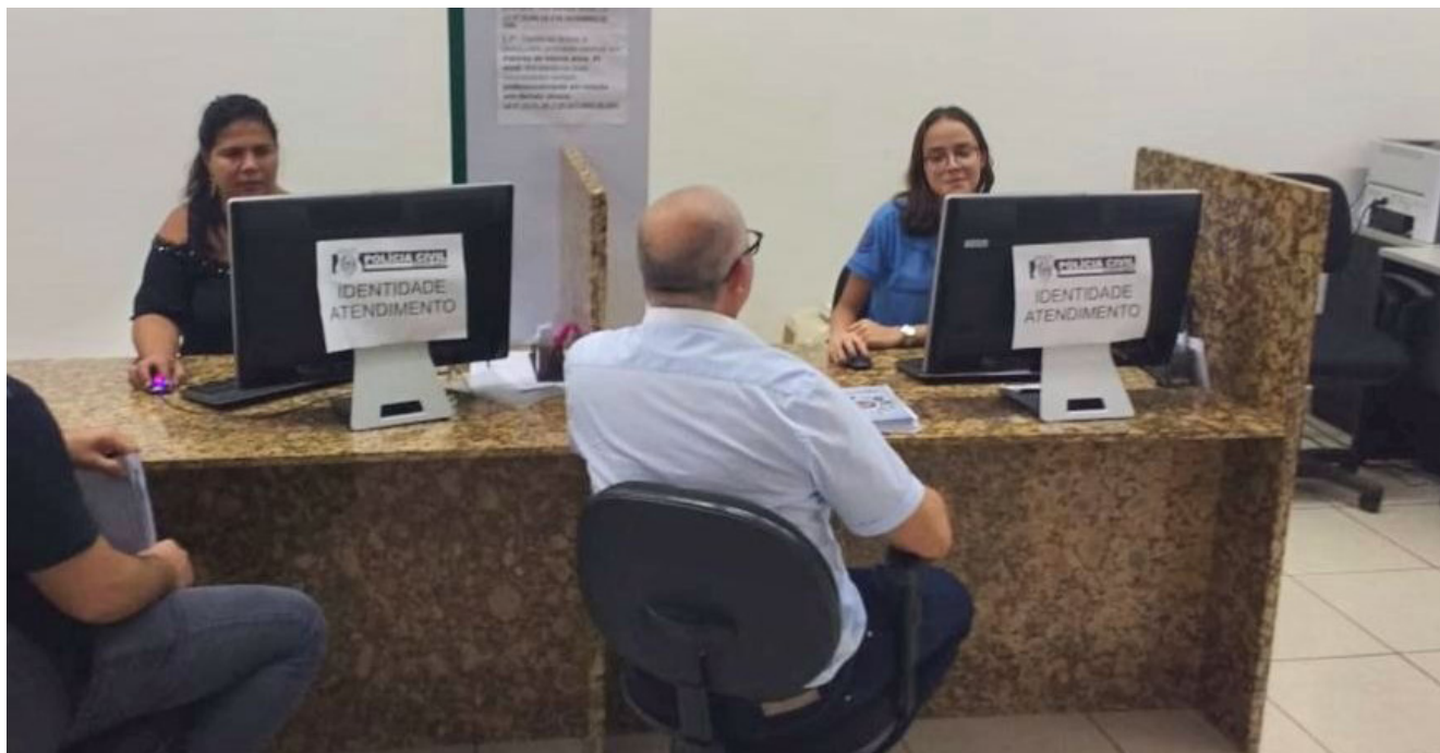
O serviço atuará com distribuição de senha somente até sexta, no local de atendimento, na Beira Rio

Não será mais preciso fila para o atendimento na Casa do Cidadão, em Cachoeiro. Nesta quarta-feira (9), entra em funcionamento o agendamento online para os serviços oferecidos no local, por meio de parceria entre o município e o governo estadual. Basta acessar agendamento.cachoeiro.es.gov.br .