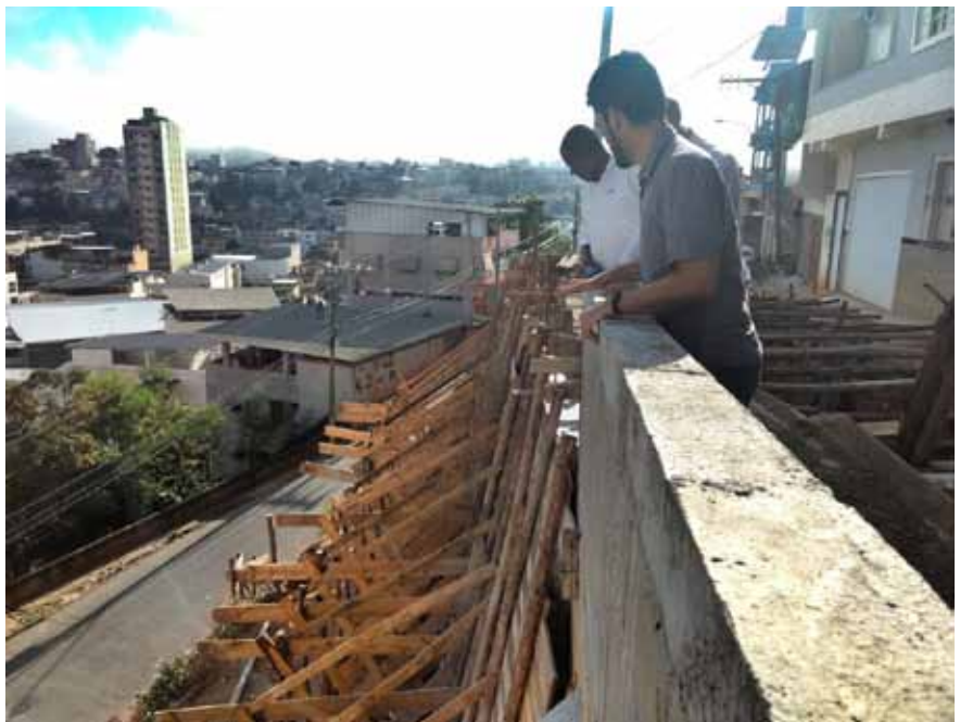
O prefeito participou de visita ao trecho com equipe da Secretaria de Obras

“Enquanto visitava a rua José Turini nesta