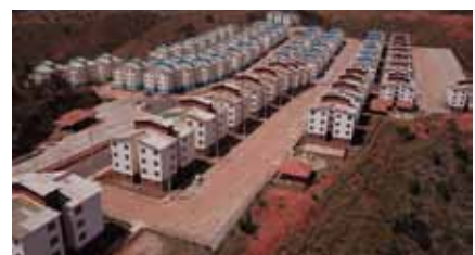
Antes da assinatura, beneficiários tem que fazer vistorias nos imóveis

beneficiários dos residenciais Otílio Roncete e, também, para selecionar famílias para futuros empreendimentos do Minha Casa Minha Vida, Cachoeiro mantém um cadastro de reserva de candidatos. Podem se inscrever famílias que moram no município há mais de dois anos, tenham renda de até R$ 1.800,00 e não possuam imóvel. Os interessados devem procurar o setor de habitação da Semdurb, que funciona na rua Brahim Antônio Seder, 96/102, Centro. O atendimento é feito das 9h às 17h.