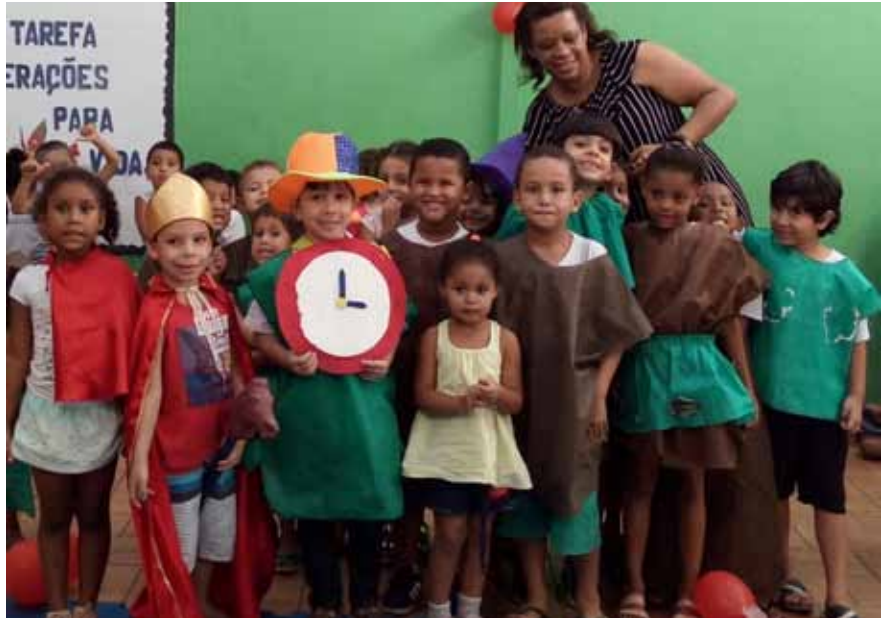
Além das atividades em sala de aula, alunos vão visitar a feira literária

“Estamos nos organizando para que todos da rede estejam sensibilizados para esse grande evento. Disponibilizaremos transportes para que o maior número possível de alunos possa desfrutar das oficinas, palestras e mostras