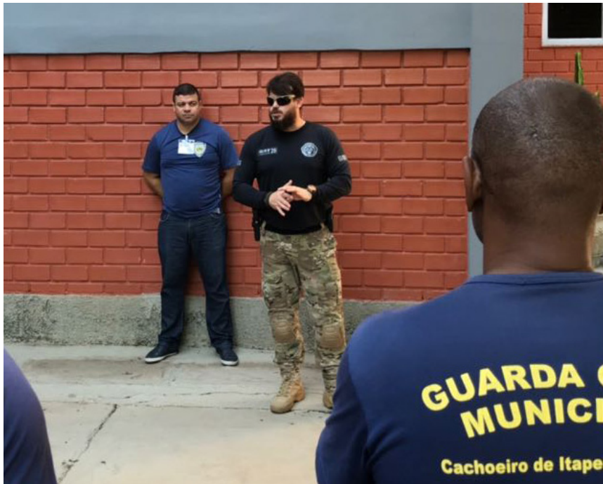
Equipe de instrutores veio de Vitória para as aulas nesta semana em Cachoeiro