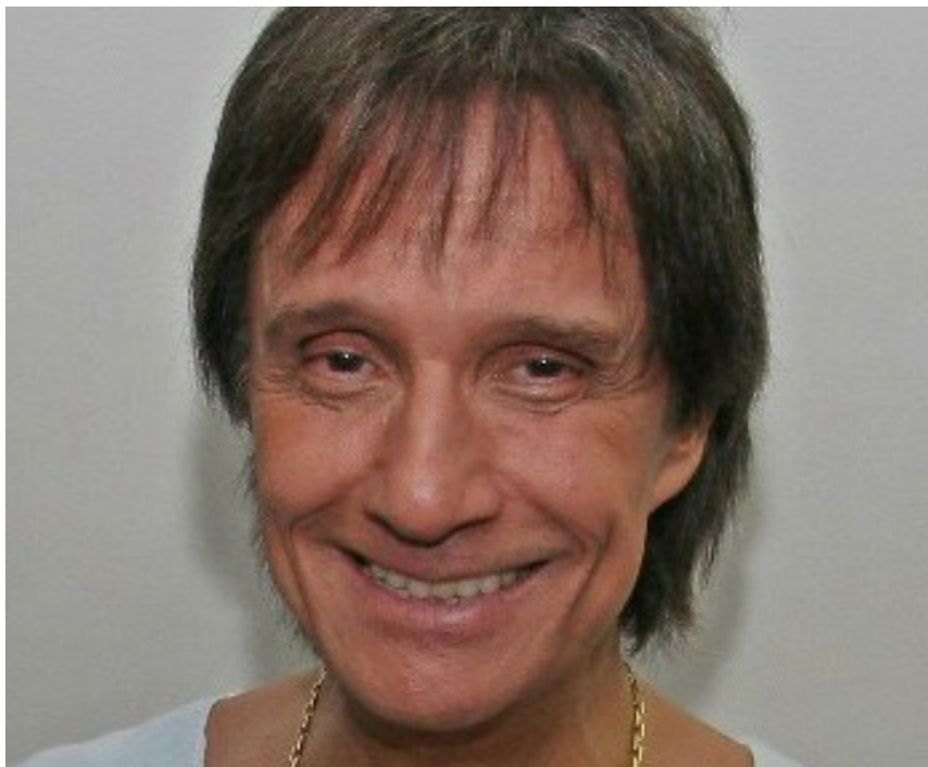
Roberto Carlos é uma das personalidades já homenageadas com o título

A eleição será em 10 de maio, às 9h, na Sala Levino Fanzeres, no térreo do palácio. O processo de escolha é feito por meio de votação secreta com um representante de cada uma das 27 entidades listadas no Decreto Nº 24.451/2014, que regulamenta a Lei Municipal Nº 6.960/2014, a qual trata da concessão de homenagens e honrarias em Cachoeiro. Em caso de empate, será eleito o candidato com mais idade.