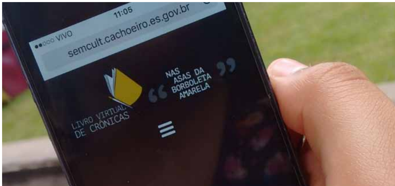
Cronistas amadores podem cadastrar textos na página até sexta-feira (13)

Mais de 130 textos foram enviados para publicação no blog “Nas asas da borboleta amarela”, projeto pré-Bienal Rubem Braga 2018 criado pela Secretaria de Cultura e Turismo de Cachoeiro de Itapemirim (Semcult) para estimular a produção de crônicas, gênero que consagrou Rubem Braga, e revelar cronistas amadores do município e região.