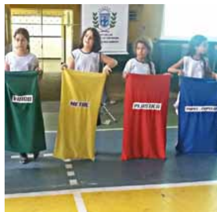
Alunos receberam orientações sobre separação dos resíduos reaproveitáveis

“As ações integram o projeto Vem Reciclar, que é uma iniciativa de importância ambiental e também socioeconômica. A coleta seletiva e a destinação de resíduos para a reciclagem não somente diminuem a acumulação de lixo na natureza, como também geram emprego e renda no município”, afirma o secretário.