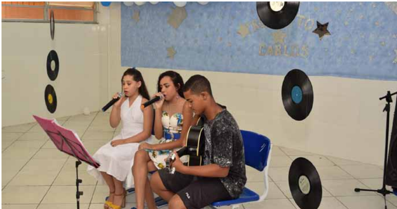
Uma das atividades da programação é o Concurso de Calouros, com estudantes da rede pública

O cantor e compositor Roberto Carlos completa 77 anos de idade, na próxima quinta-feira (19), e Cachoeiro de Itapemirim, sua cidade natal, celebrará o aniversário durante toda a próxima semana, com programação especial organizada pela prefeitura, por meio da Secretaria Municipal de Cultura e Turismo (Semcult).