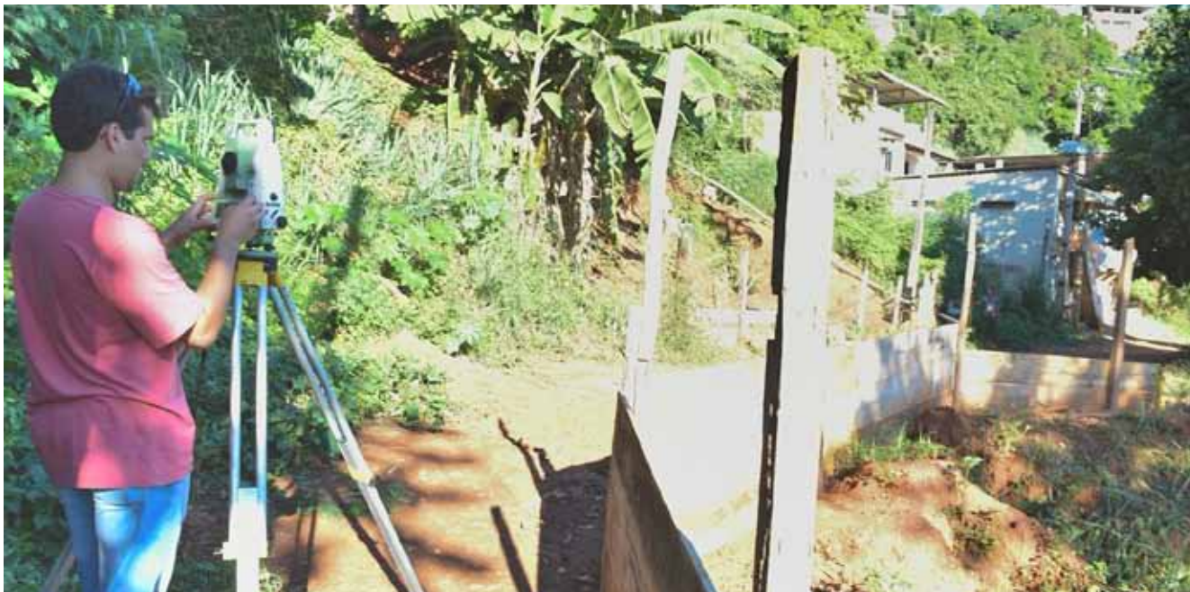
Área com três ruas ganha pavimentação, rede de drenagem e muros de contenção

Na parte alta do bairro Rubem Braga, em Cachoeiro, três ruas começaram a ganhar obras de drenagem e contenção na manhã desta terça-feira (10), entre elas a Wilson Duarte Silva, onde, há muitos meses, uma cratera toma a maior parte da via. Dez operários da prefeitura atuam no local.