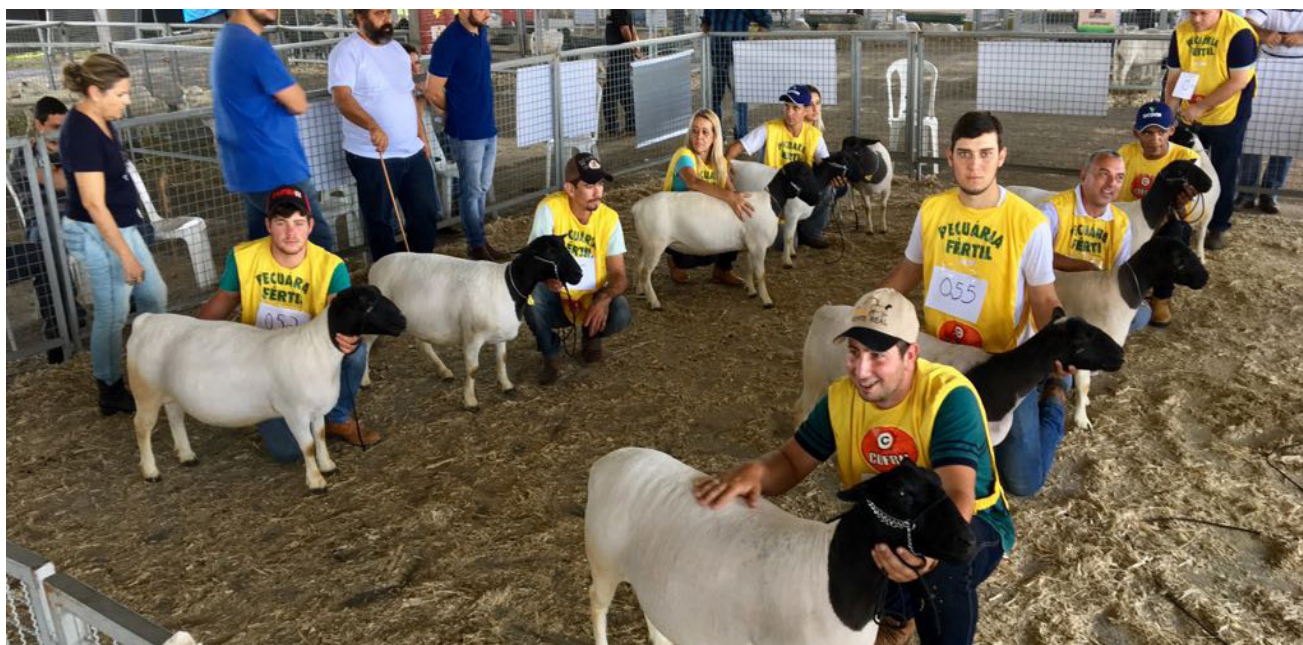
Área dos pavilhões de animais é uma das principais atrações da feira

A Exposição Agropecuária tem uma programação à parte dentro da ExpoSul Rural, feira do setor agro que acontece entre esta quarta-feira e domingo (11 a 15), no Parque de Exposições Carlos Caiado Barbosa, no bairro Aeroporto. Competições rurais, atividades de lazer e exibição de animais estão entre as atrações do evento, organizado pela prefeitura de Cachoeiro e pelo Sindicato Rural do município.