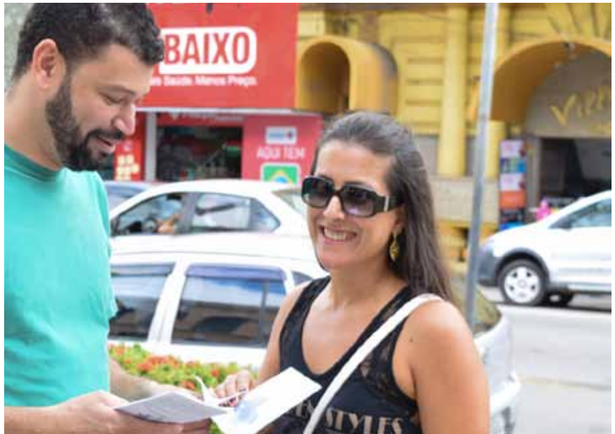
Atividade é promovida pela equipe do Cerest, como parte do Abril Verde

O Cerest-CI tem por objetivo o desenvolvimento de ações de promoção, prevenção, vigilância, diagnóstico, tratamento e reabilitação em Saúde do Trabalhador no âmbito do SUS. Sua atuação se estende aos demais municípios do Sul do Estado.