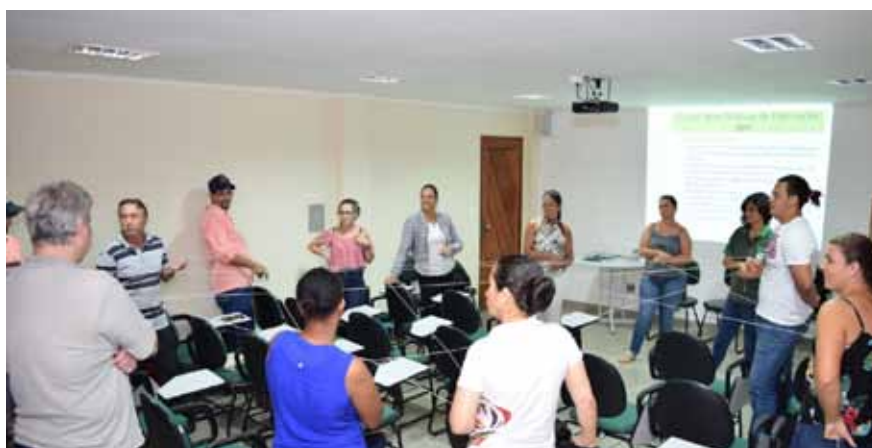
Participantes aprendem técnicas para melhorar e garantir a qualidade do produto que comercializam

Dessa forma, a prefeitura oferece orientação para que as agroindústrias tenham o conhecimento necessário para atender a todas as normas vigentes relacionadas aos cuidados sanitários na produção.