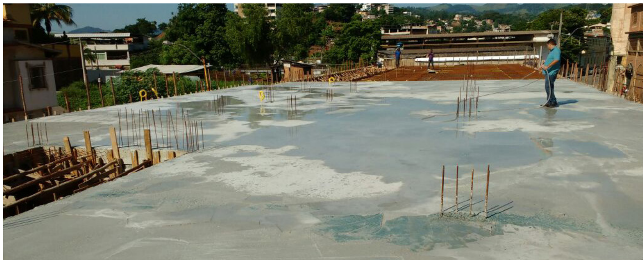
Estão em andamento no bairro Coronel Borges as obras da nova escola Olga Dias

A prefeitura de Cachoeiro de Itapemirim está construindo um novo prédio para a escola municipal Olga Dias da Costa Mendes, no bairro Coronel Borges, e reformará outras 25 unidades de ensino. Cerca de R$ 10 milhões serão investidos nessas obras, que fazem parte do Programa de Investimentos com recursos próprios do município para 2018 e 2019.