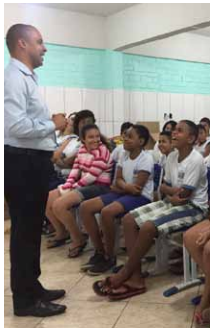
Ação faz parte do projeto Procon Vai à Escola

Em continuidade às comemorações do Dia do Consumidor, o Procon Cachoeiro deslocará sua equipe de trabalho para a praça Jerônimo Monteiro, Centro, entre as próximas quarta e sexta-feira (14 a 16), das 9h às 17h. Nesses dias, a sede da agência, no bairro Guandu, funcionará apenas para consumidores receberem retorno sobre Carta de Investigação Preliminar (CIP), formalização de denúncias e expediente interno. Na ocasião, os consumidores terão a oportunidade de receber todo tipo de atendimento realizado pelo órgão, desde o esclarecimento de uma dúvida até formalização de reclamações por cobranças abusivas ou orientação em renegociação de dívidas. Também na terça-feira, o Procon receberá uma homenagem na Câmara Municipal de Cachoeiro, às 16h, seguida de um pronunciamento sobre direito do consumidor proferido pelo coordenador do órgão. Na sexta (16), além da programação na praça, parte da equipe da agência cachoeirense do órgão participará do III Encontro do Ministério Público com os Procons Municipais, a ser realizado no auditório da Procuradoria Geral de Justiça do Espírito Santo, em Vitória.