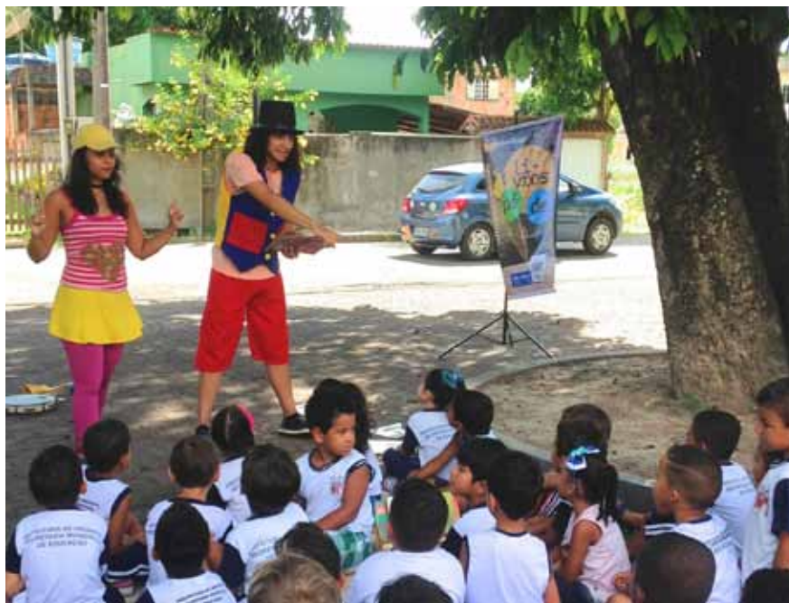
Faltam apenas nove espaços para iniciativa chegar à Bienal Rubem Braga 2018, em maio

As próximas ações do Pé de Livros, neste mês, estão agendadas para o bairro Paraíso, em Cachoeiro, no dia 21, e na localidade de Tijuca, também no município, em 28 de março.