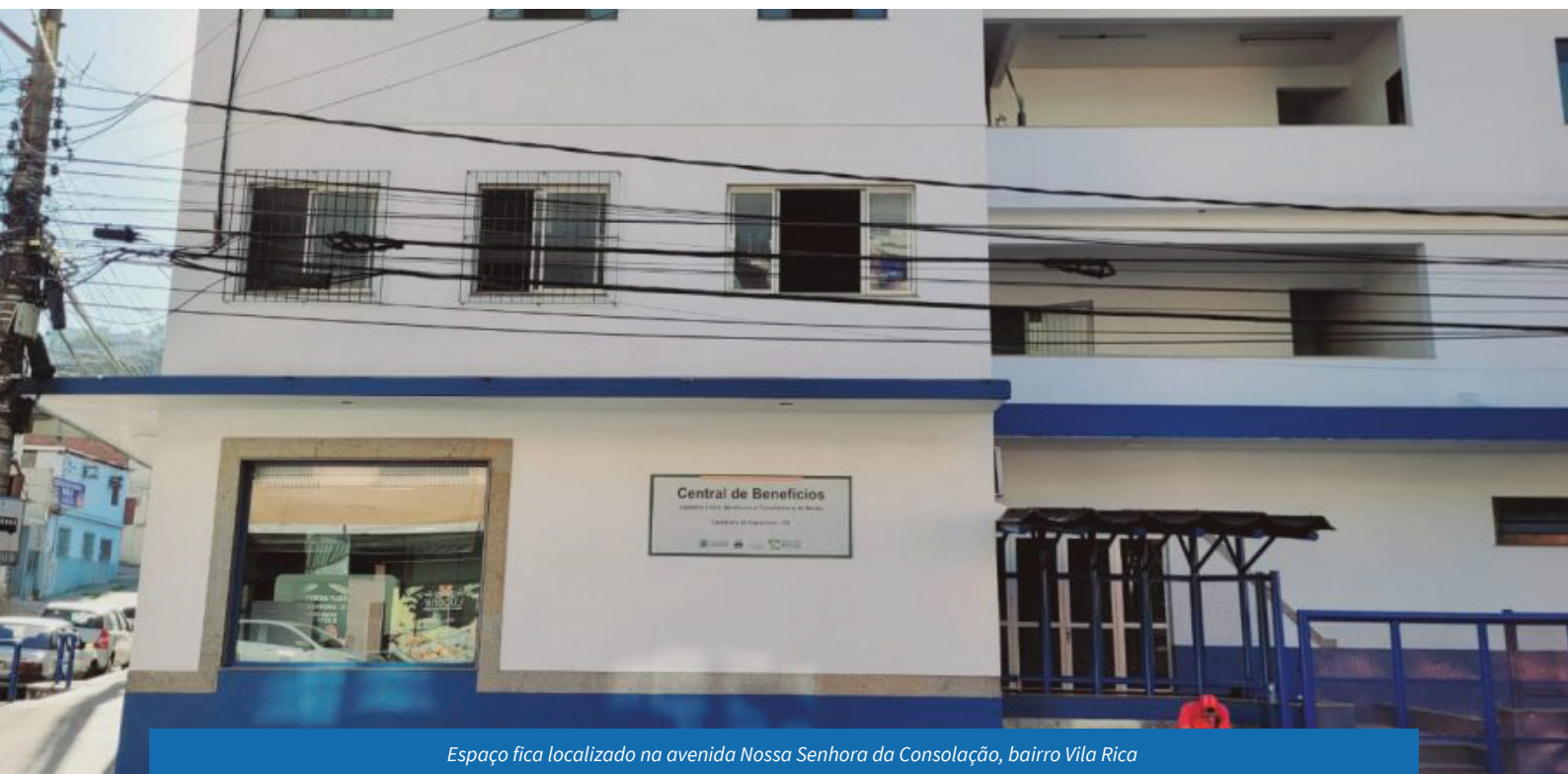
Espaço fica localizado na avenida Nossa Senhora da Consolação, bairro Vila Rica