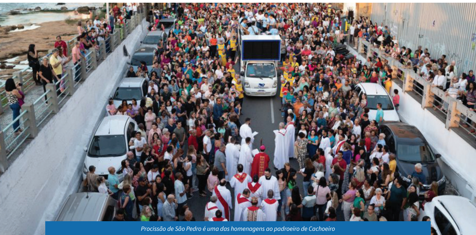
Procissão de São Pedro é uma das homenagens ao padroeiro de Cachoeiro