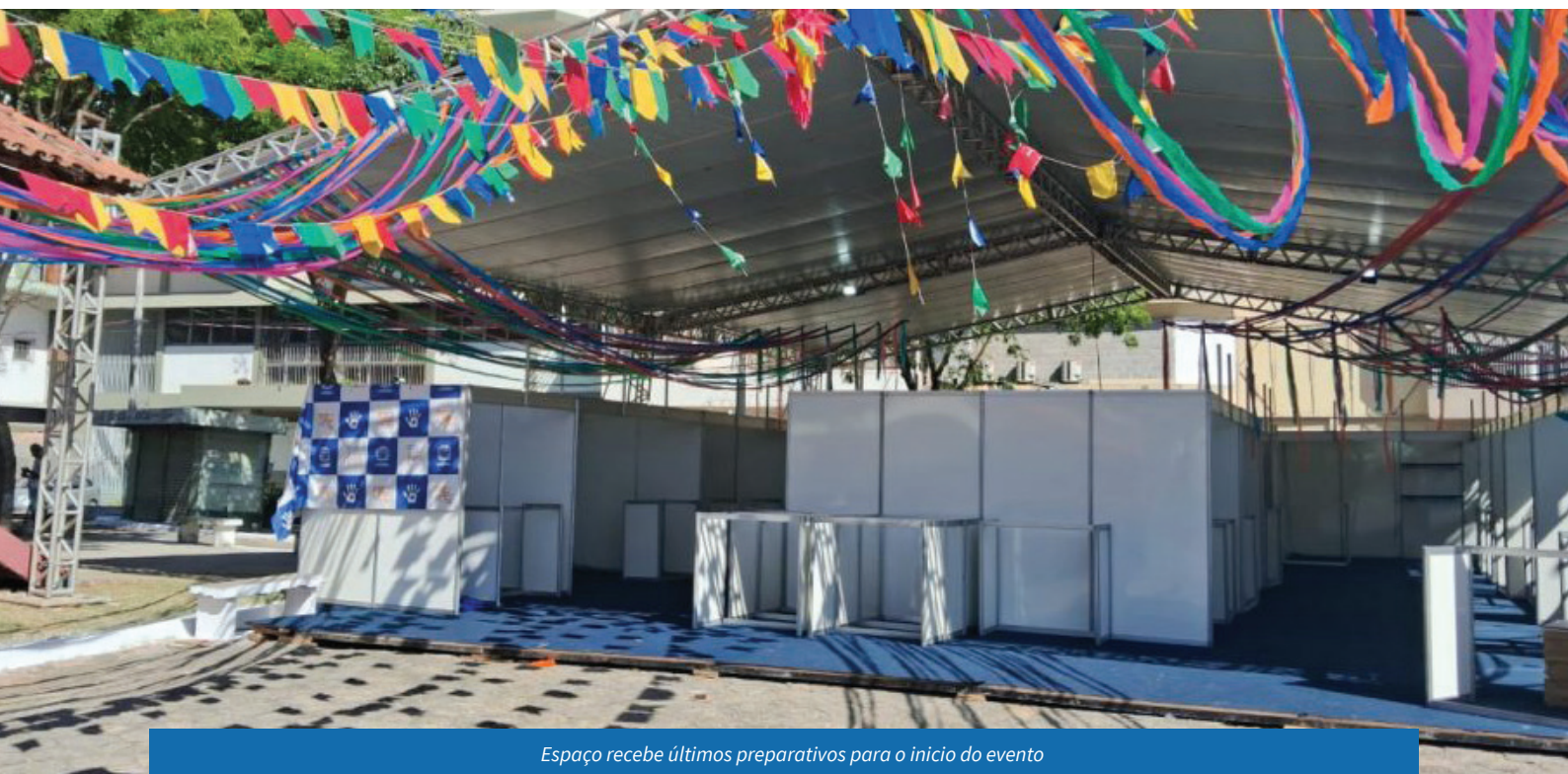
Espaço recebe últimos preparativos para o início do evento