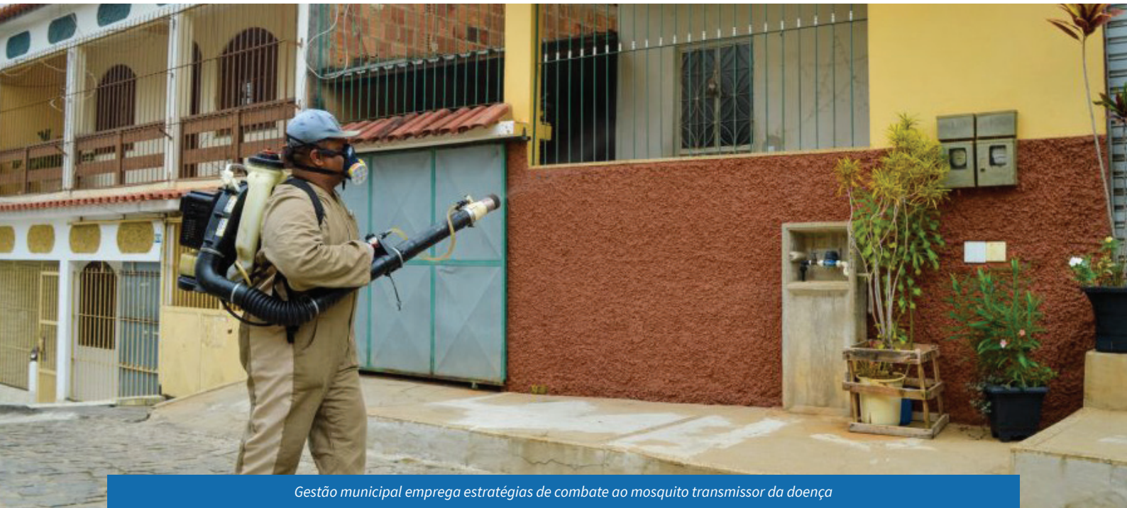
Gestão municipal emprega estratégias de combate ao mosquito transmissor da doença