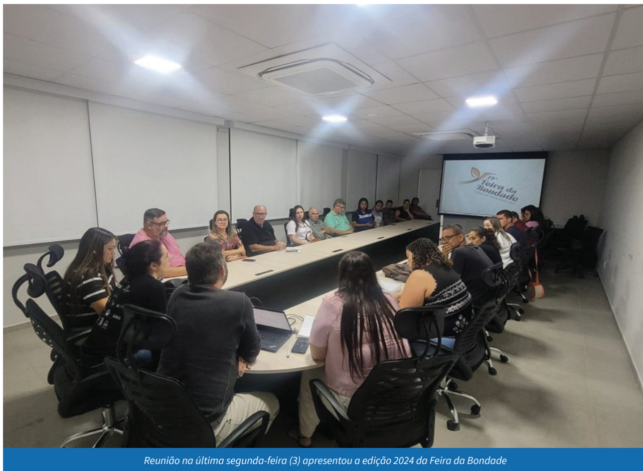
Reunião na última segunda-feira (3) apresentou a edição 2024 da Feira da Bondade

dar visibilidade aos trabalhos realizados por diversas entidades sociais, em um grande espaço de solidariedade. Esperamos que toda a comunidade participe e apoie essas organizações que desempenham um papel fundamental em Cachoeiro”, afirmou a primeira-dama.