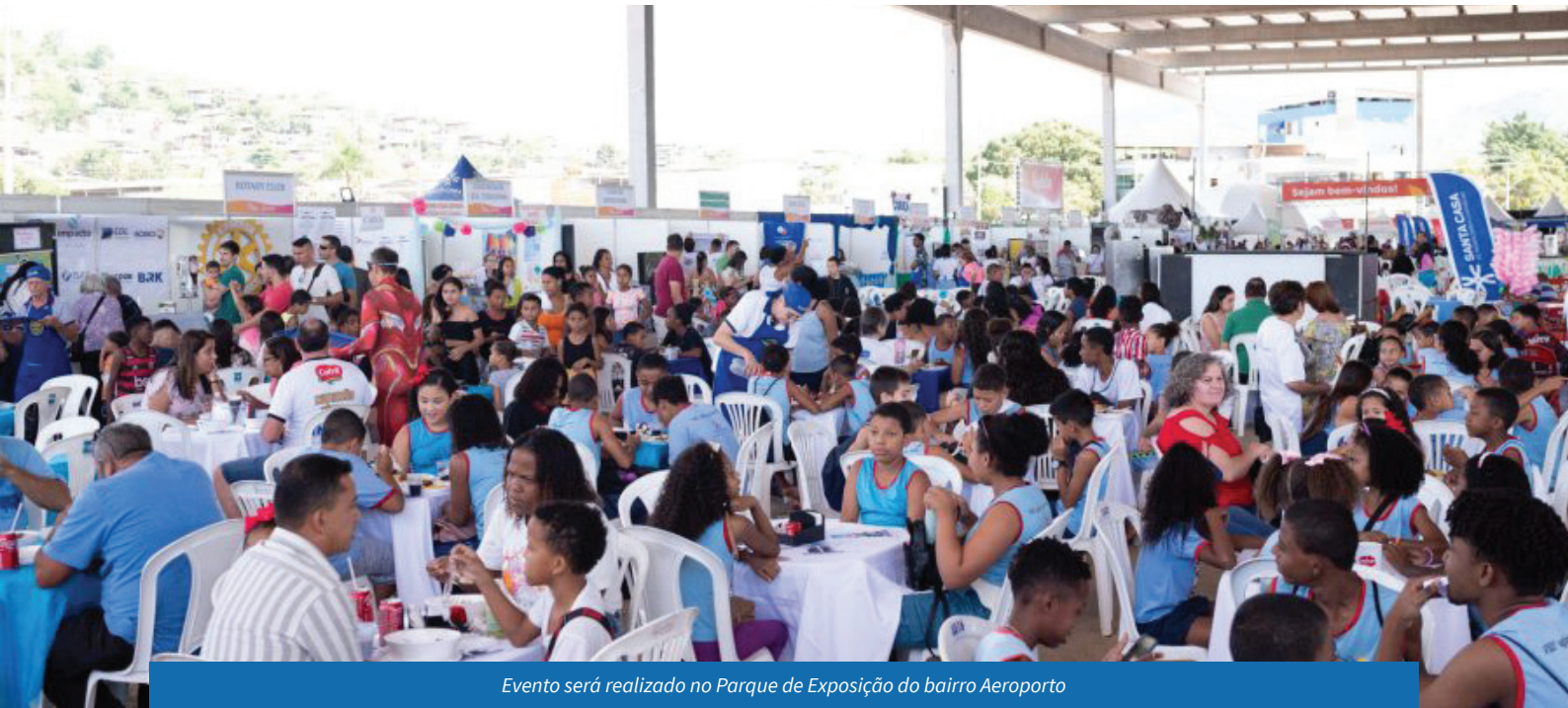
Evento será realizado no Parque de Exposição do bairro Aeroporto