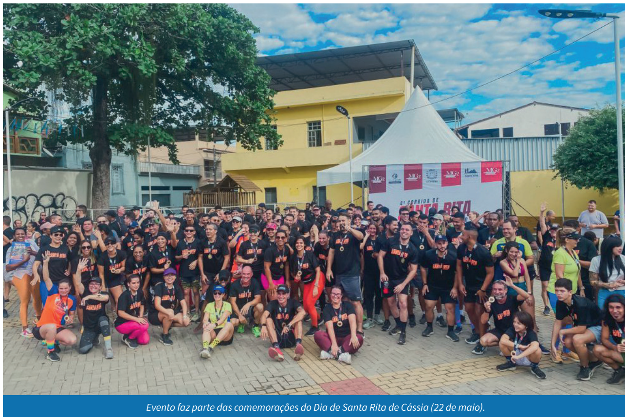
Evento faz parte das comemorações do Dia de Santa Rita de Cássia (22 de maio).

de fraldas geriátricas, que foram doadas pelos corredores no momento da retirada do kit de participação. Todos os pacotes serão destinados à instituição filantrópica do município.