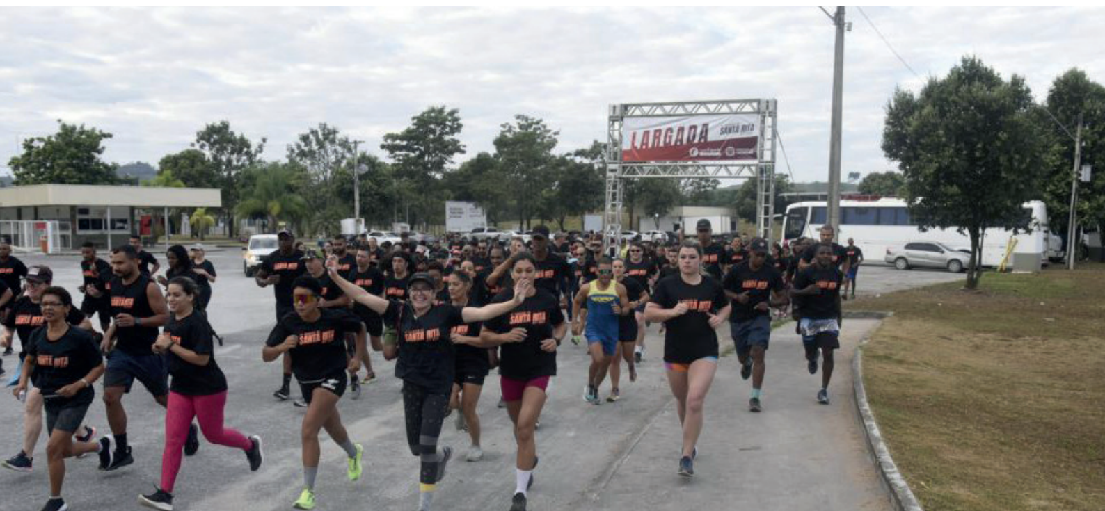
Corredores enfrentaram um percurso de 6 quilômetros, misturando asfalto e trechos de terra