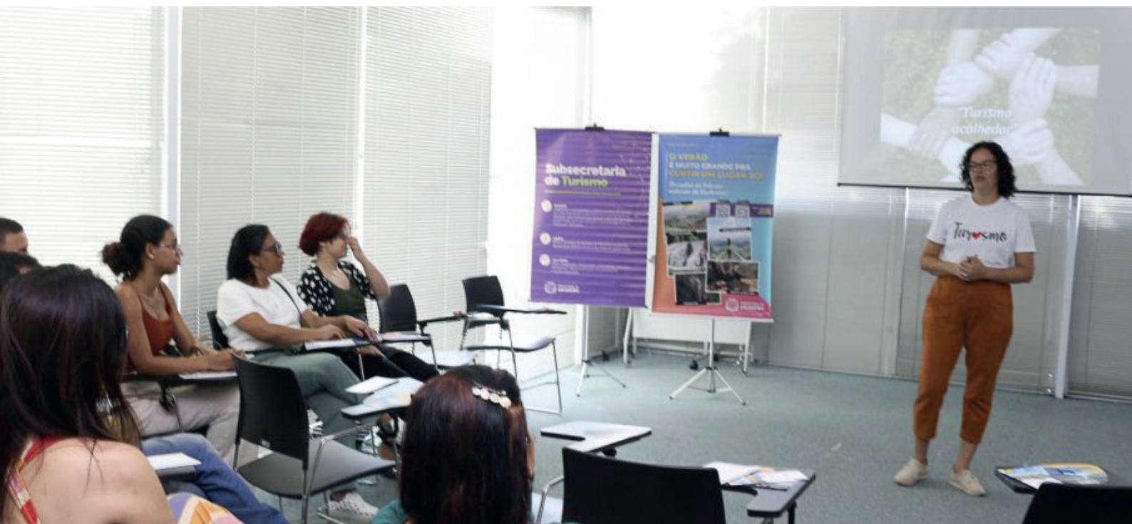
Evento foi realizado no auditório do Sebrae Cachoeiro