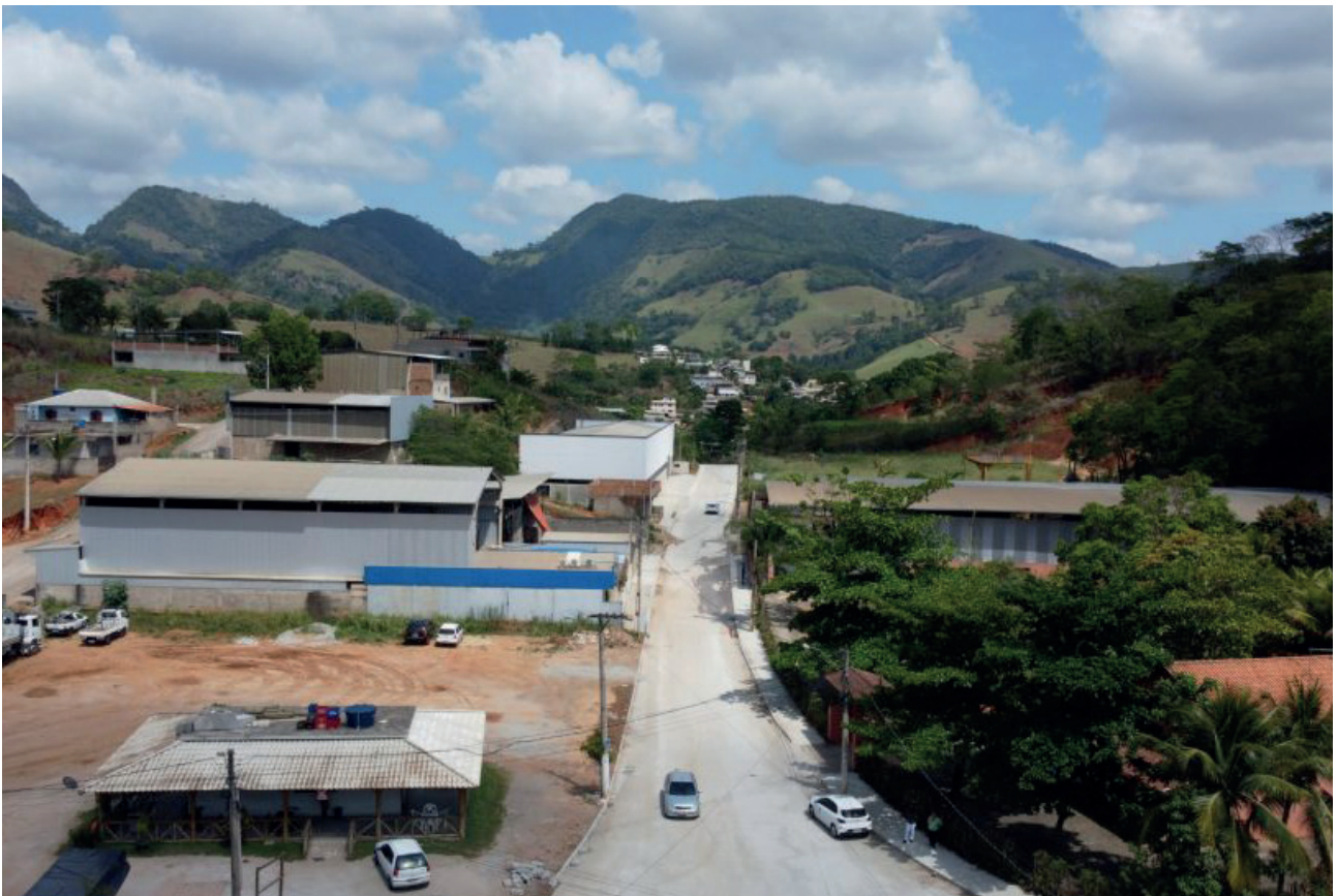
No total, foram realizadas melhorias em 1,3 quilômetro em extensão dia

cionar não apenas ruas mais seguras e duradouras, mas também para elevar a qualidade de vida dos nossos cidadãos. Cada melhoria concretizada é um grande passo rumo ao futuro de Cachoeiro”, afirmou o prefeito Victor Coelho durante a solenidade.