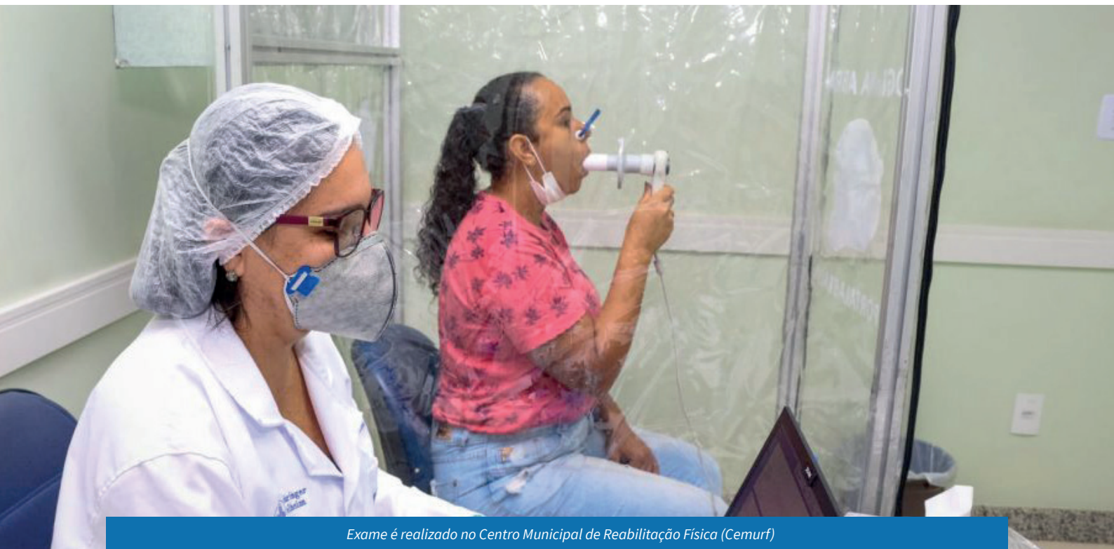
Exame é realizado no Centro Municipal de Reabilitação Física (Cemurf)