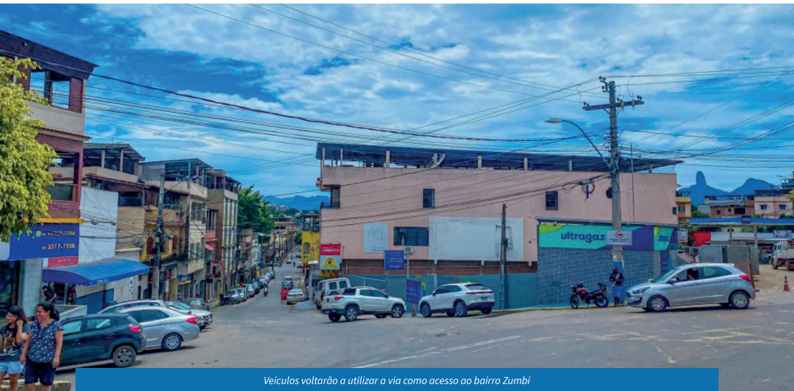
Veículos voltarão a utilizar a via como acesso ao bairro Zumbi