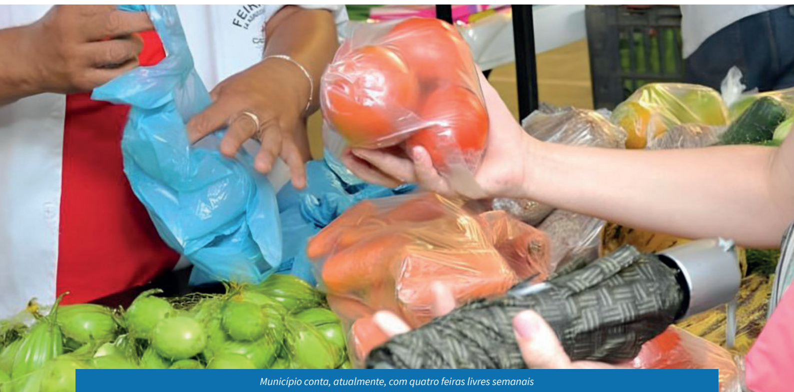
Município conta, atualmente, com quatro feiras livres semanais