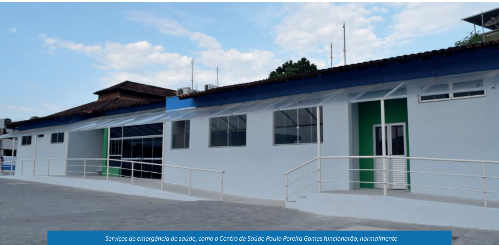
Serviços de emergência de saúde, como o Centro de Saúde Paulo Pereira Gomes funcionarão, normalmente