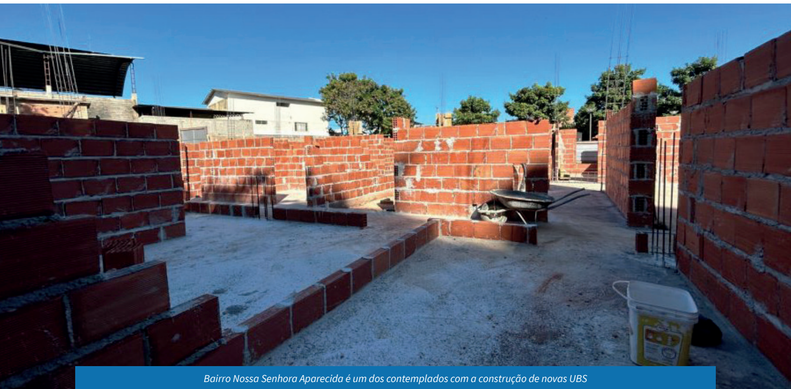
Bairro Nossa Senhora Aparecida é um dos contemplados com a construção de novas UBS