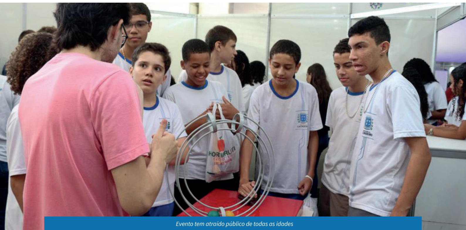
Evento tem atraído público de todas as idades