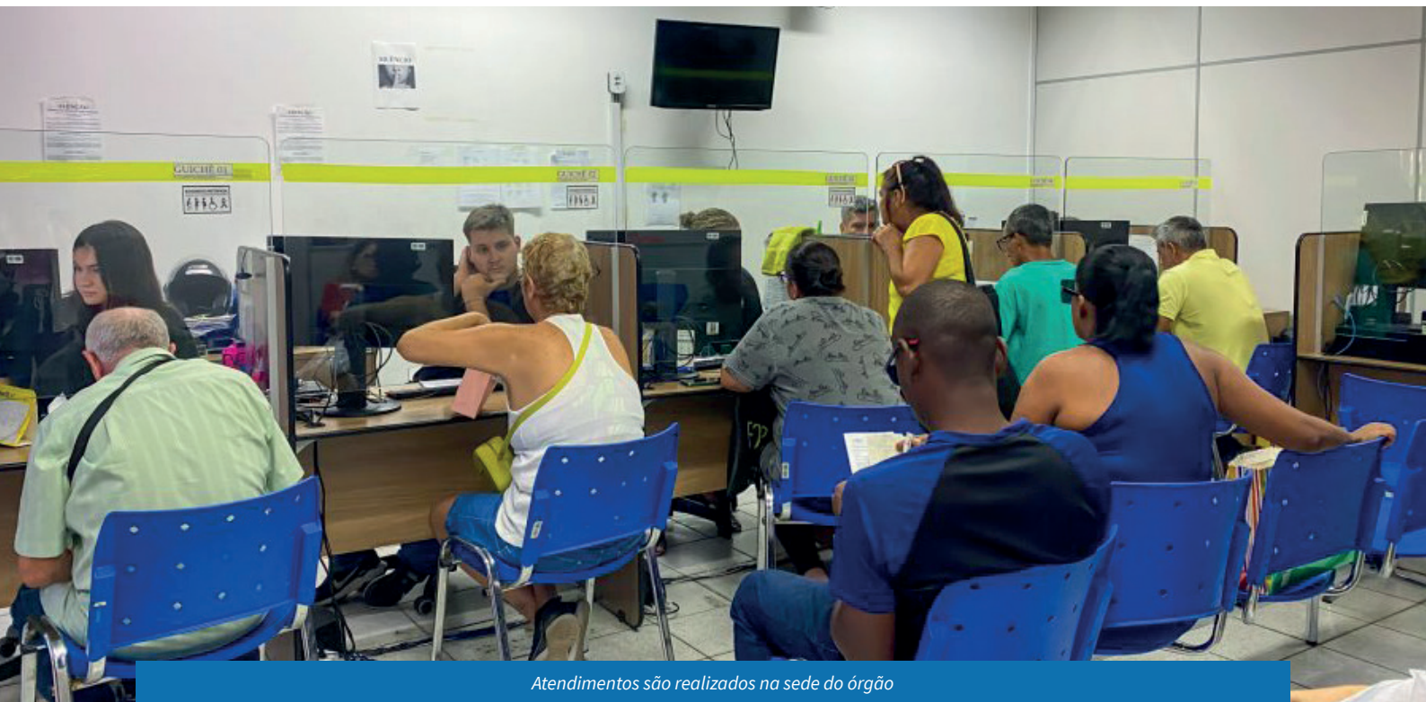
Atendimentos são realizados na sede do órgão