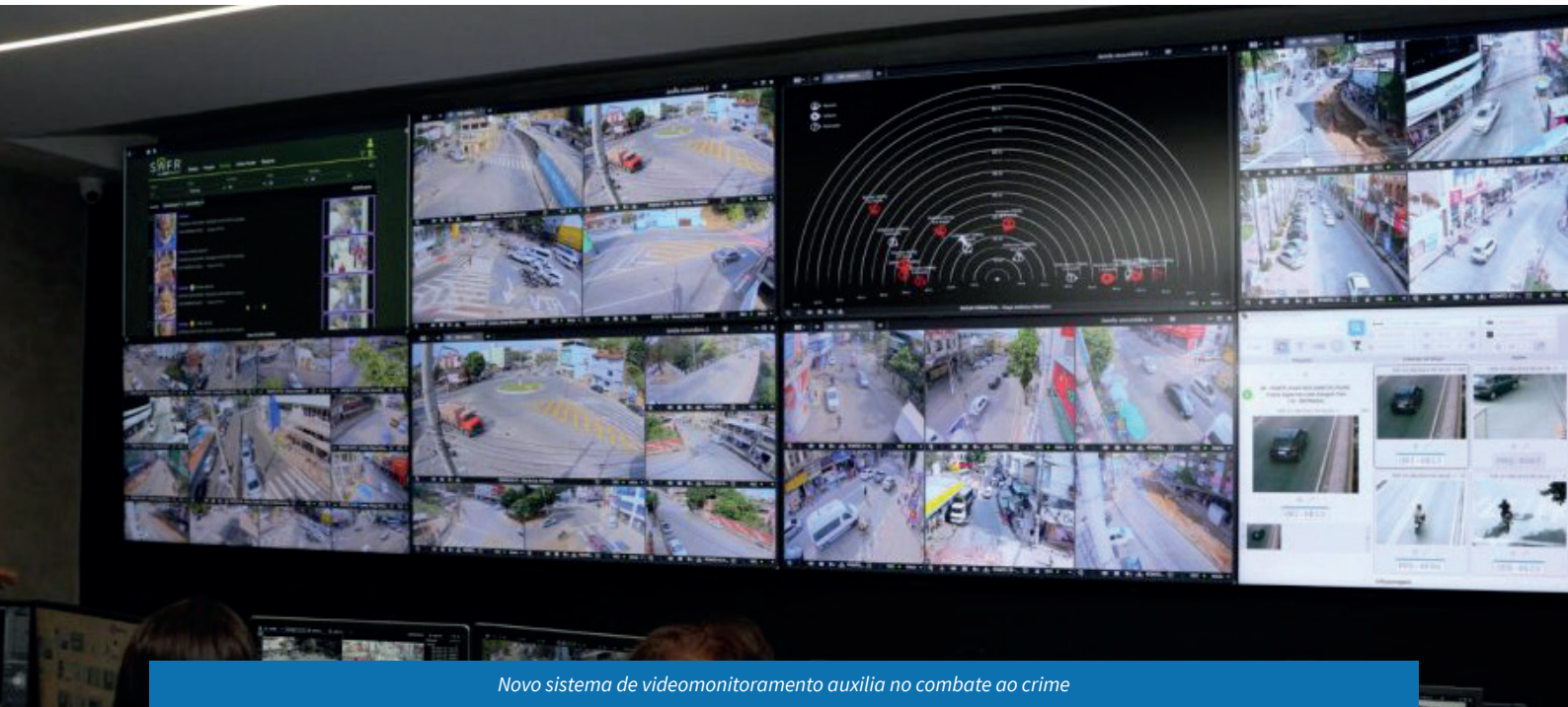
Novo sistema de videomonitoramento auxilia no combate ao crime