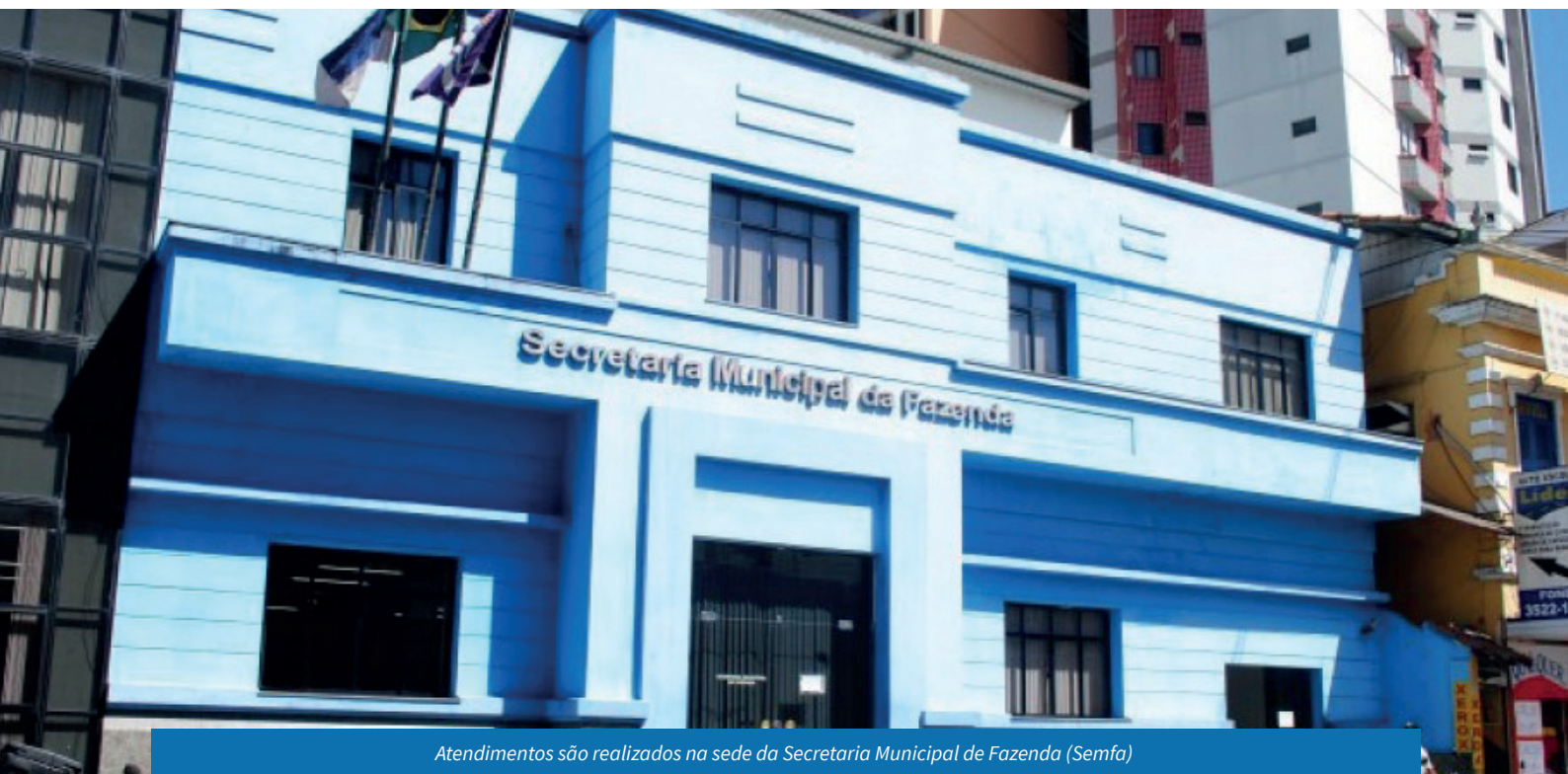
Atendimentos são realizados na sede da Secretaria Municipal de Fazenda (Semfa)