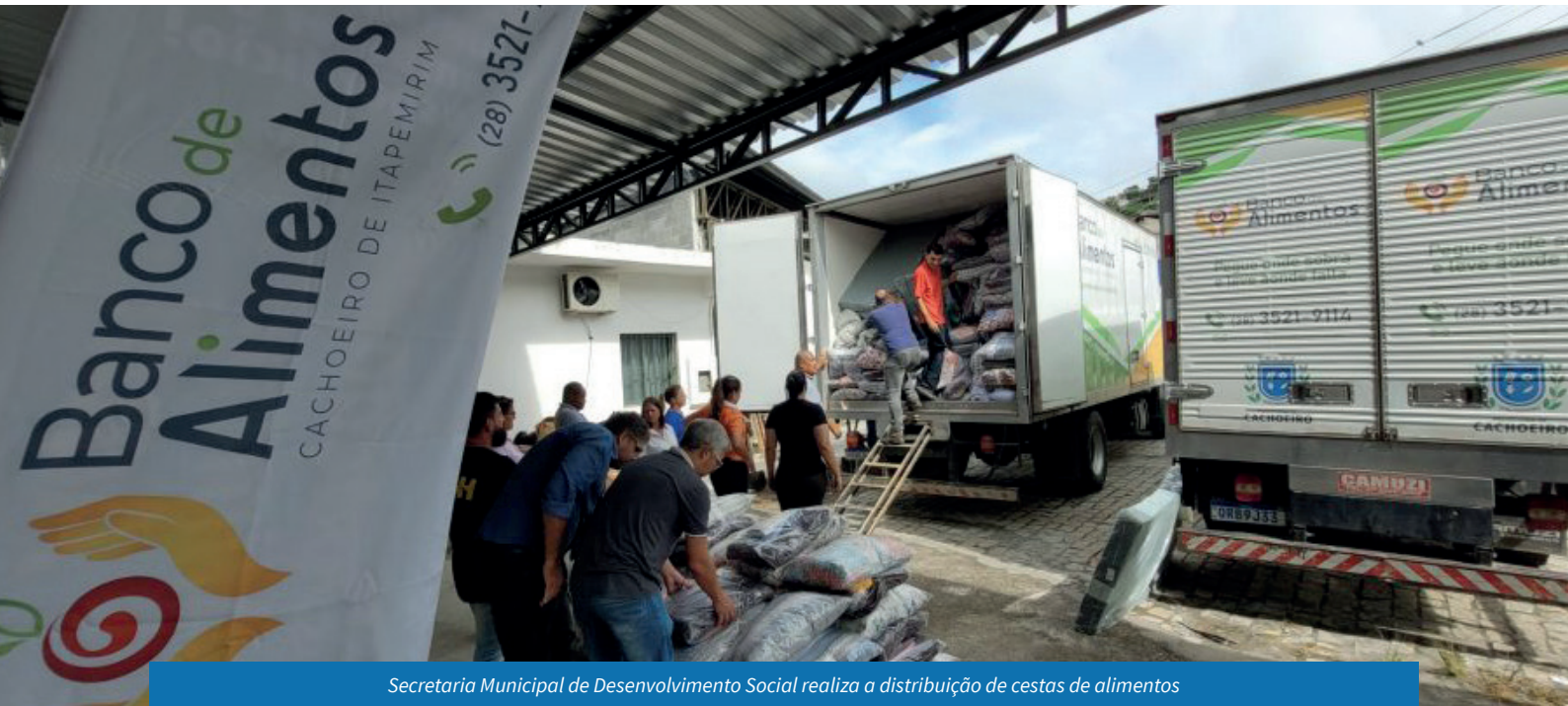
Secretaria Municipal de Desenvolvimento Social realiza a distribuição de cestas de alimentos