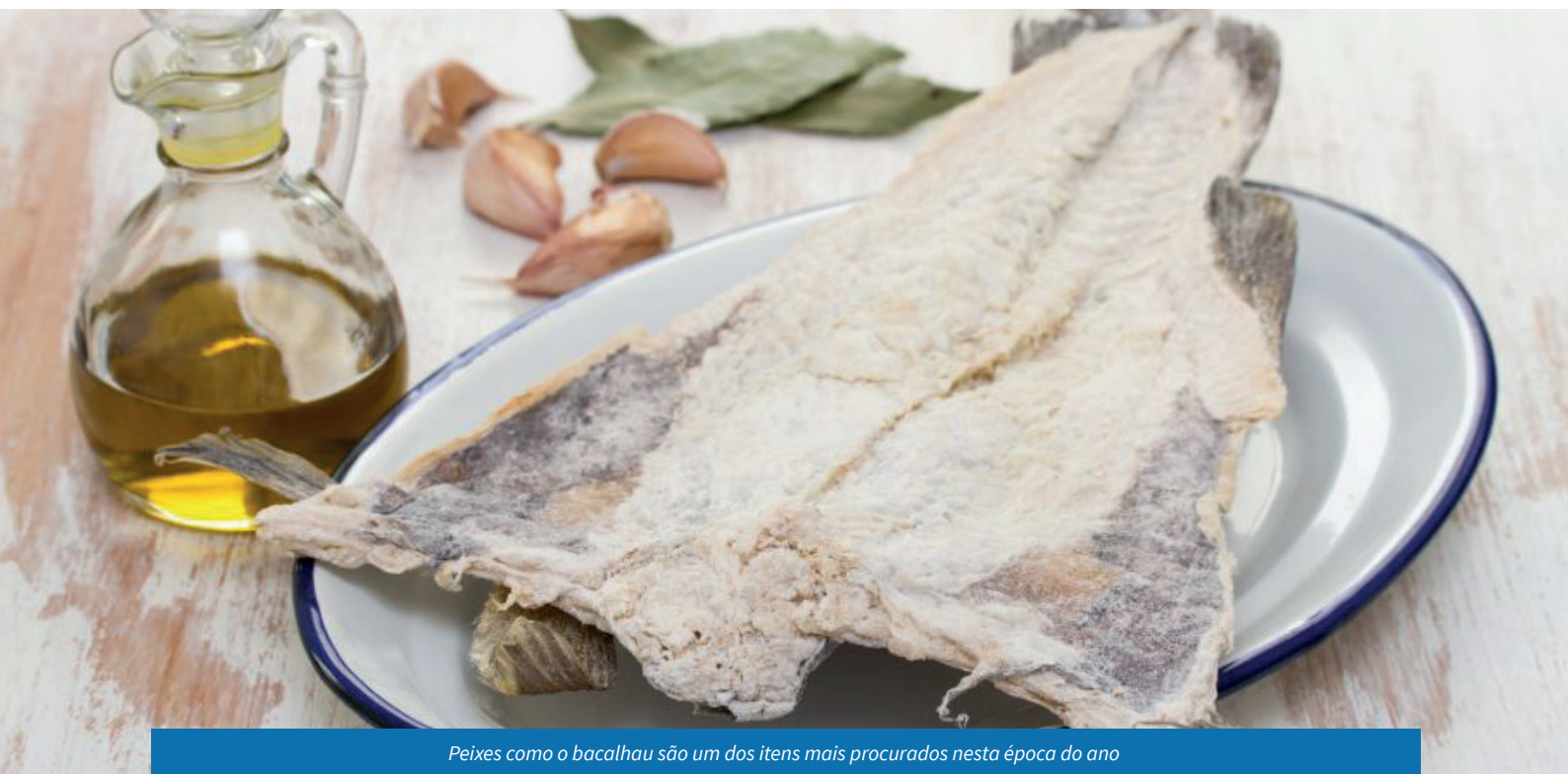
Peixes como o bacalhau são um dos itens mais procurados nesta época do ano