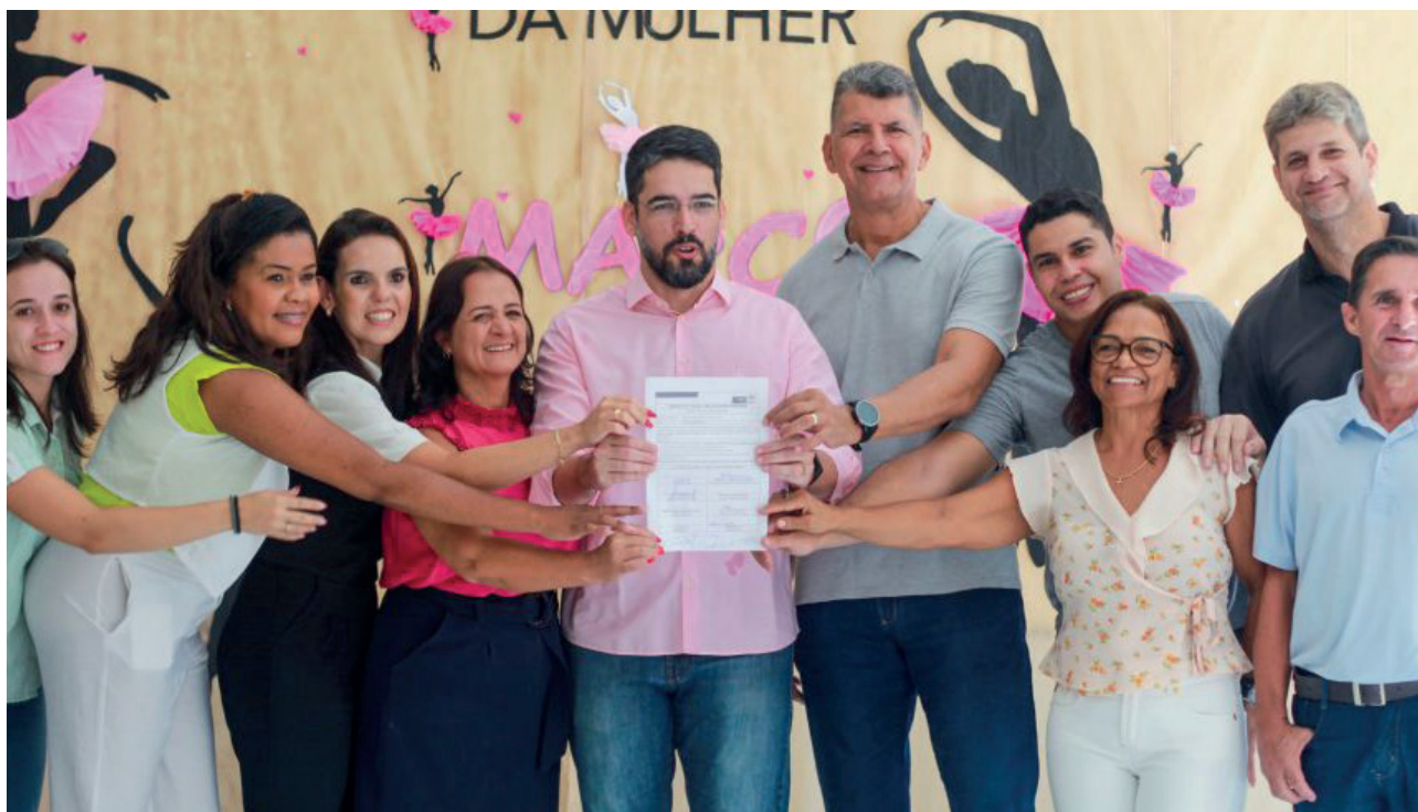
Solenidade de ordem de serviço aconteceu na manhã desta sexta (8)

A população da região beneficiada direta e indiretamente pela reforma é de mais de 20 mil moradores. Os bairros contemplados pelo atendimento no Cras na região incluem Jardim America, IBC, Agostinho Simonato, Monte Cristo, Boa esperança, Caiçara, BNH de Baixo e BNH de Cima.