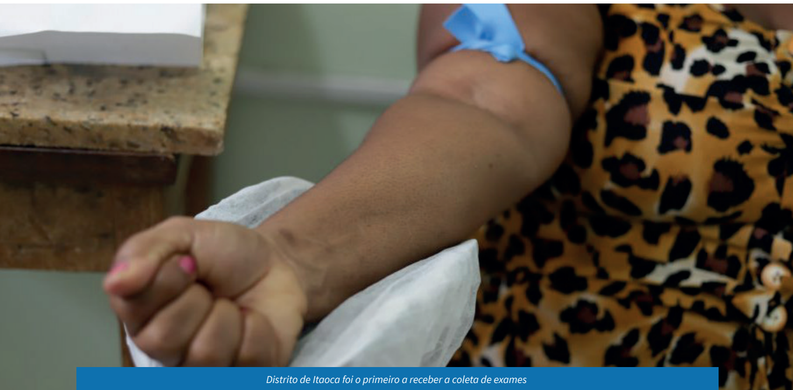
Distrito de Itaoca foi o primeiro a receber a coleta de exames