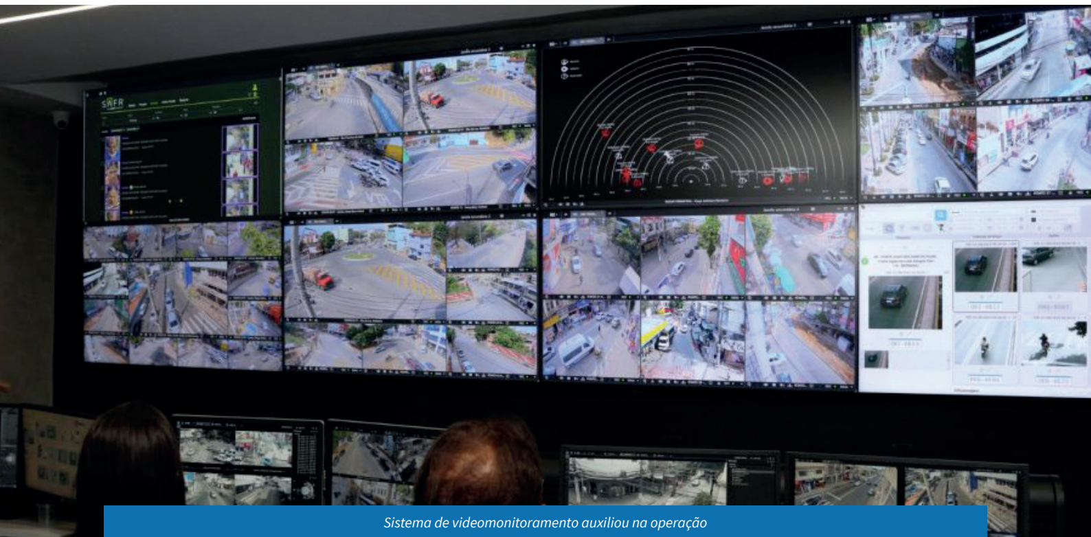
Sistema de videomonitoramento auxiliou na operação