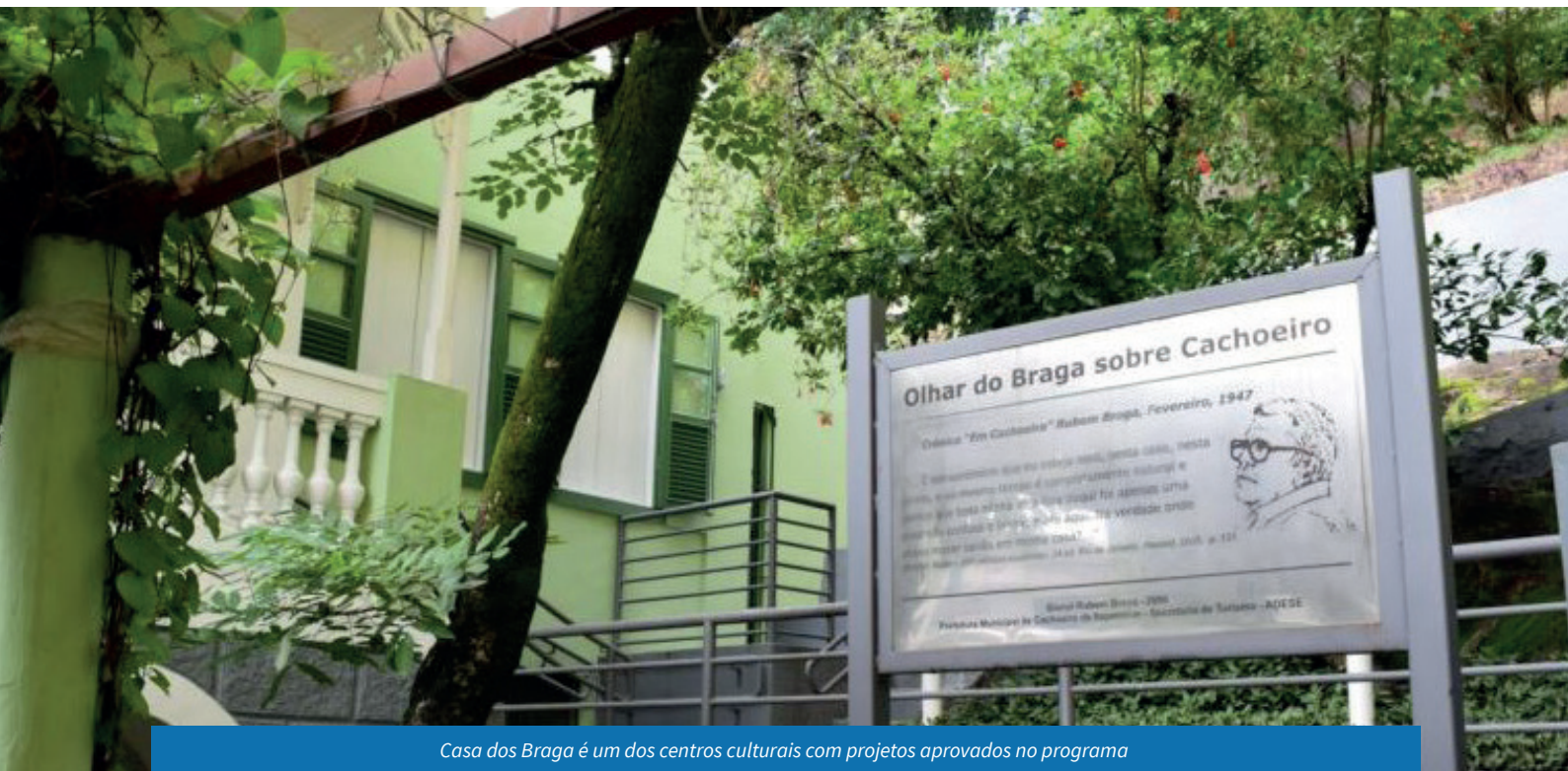
Casa dos Braga é um dos centros culturais com projetos aprovados no programa