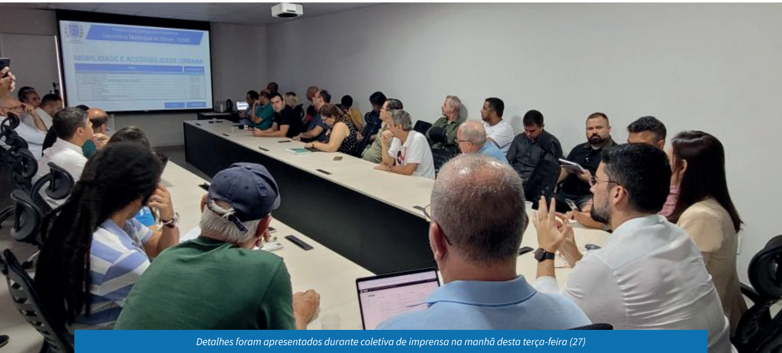
Detalhes foram apresentados durante coletiva de imprensa na manhã desta terça-feira (27)