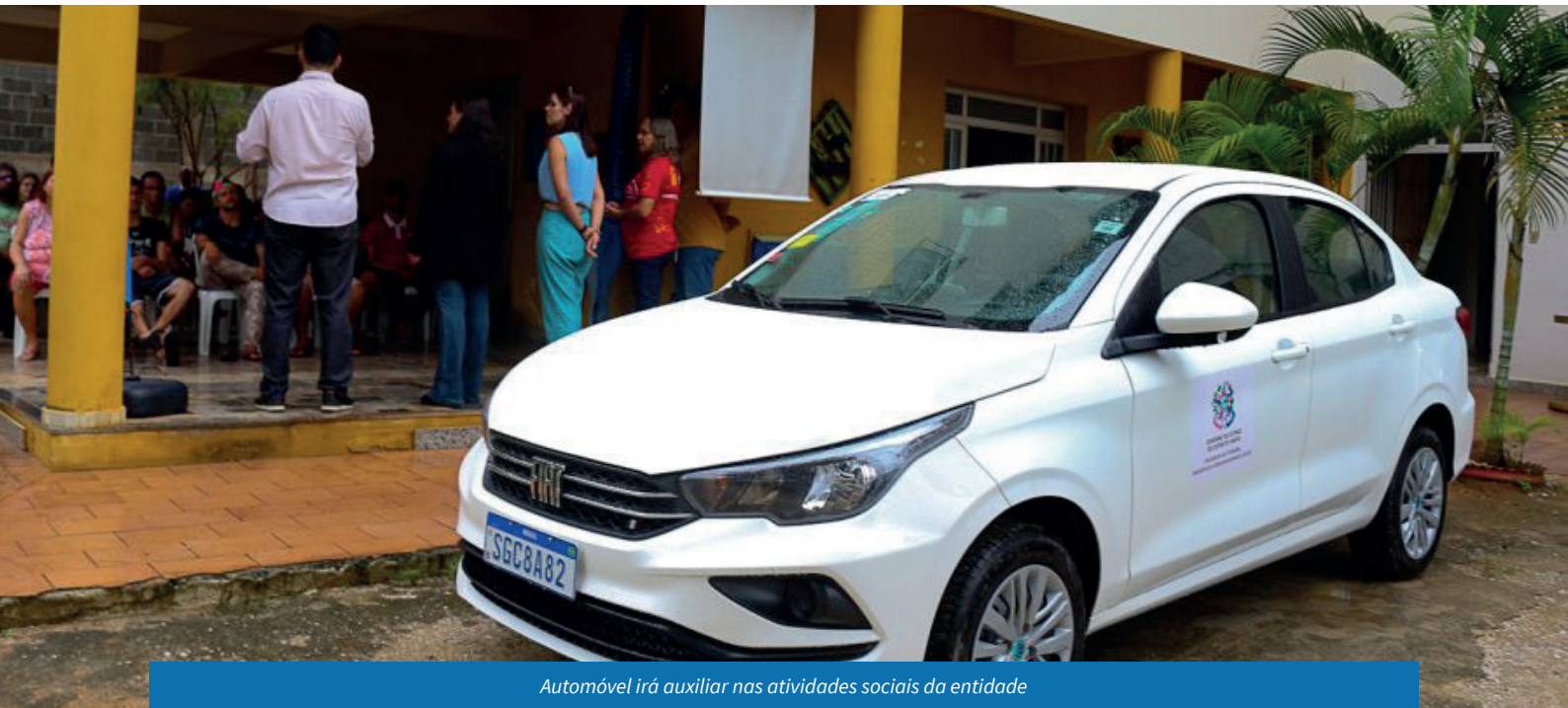
Automóvel irá auxiliar nas atividades sociais da entidade