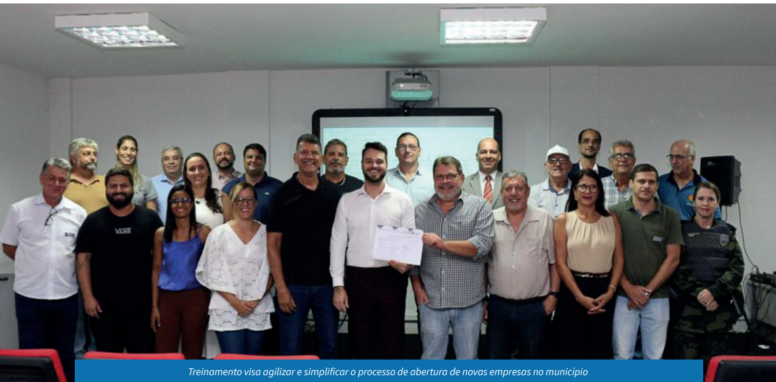
Treinamento visa agilizar e simplificar o processo de abertura de novas empresas no município