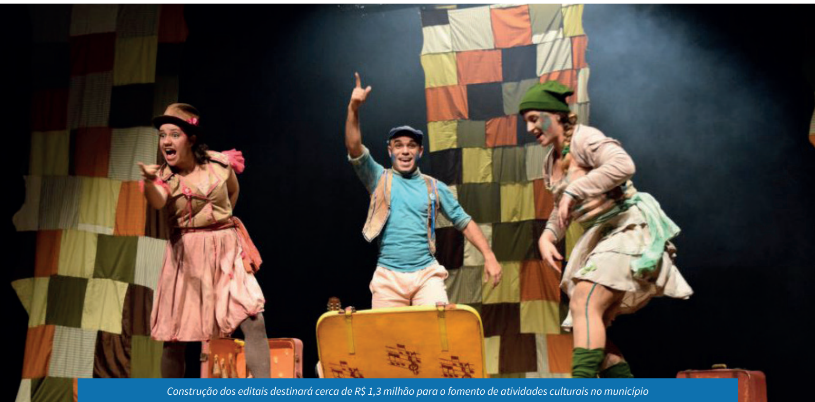
Construção dos editais destinará cerca de R$ 1,3 milhão para o fomento de atividades culturais no município