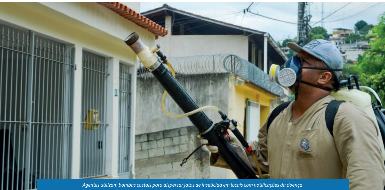
Agentes utilizam bombas costais para dispersar jatos de inseticida em locais com notificações da doença